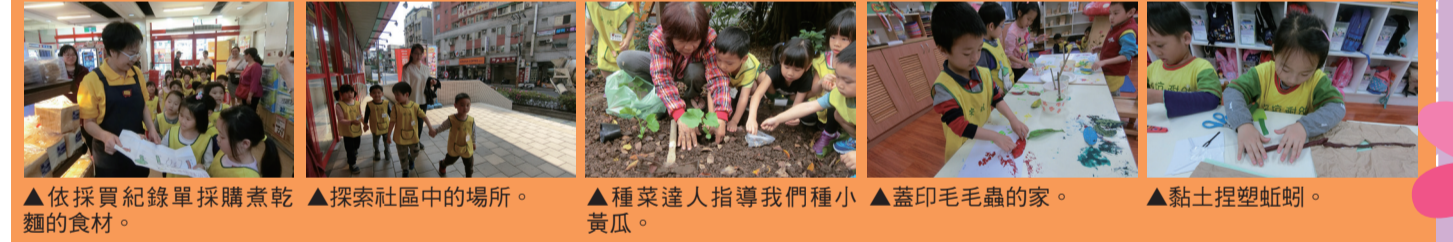
▲依採買紀錄單採購餅乾 ▲探索社區中的場所。 ▲種菜達人指導我們種小黃瓜。 ▲蓋印毛毛蟲的家。 ▲黏土捏塑蚯蚓。

從孩子們的生活環境中探索與學習；認識學校社區中的場所，樂於親近自然、愛護生命，進而培養關懷大自然的情操；利用各種表達方式傳達動手操作過程中的感受，而看見自己的價值。