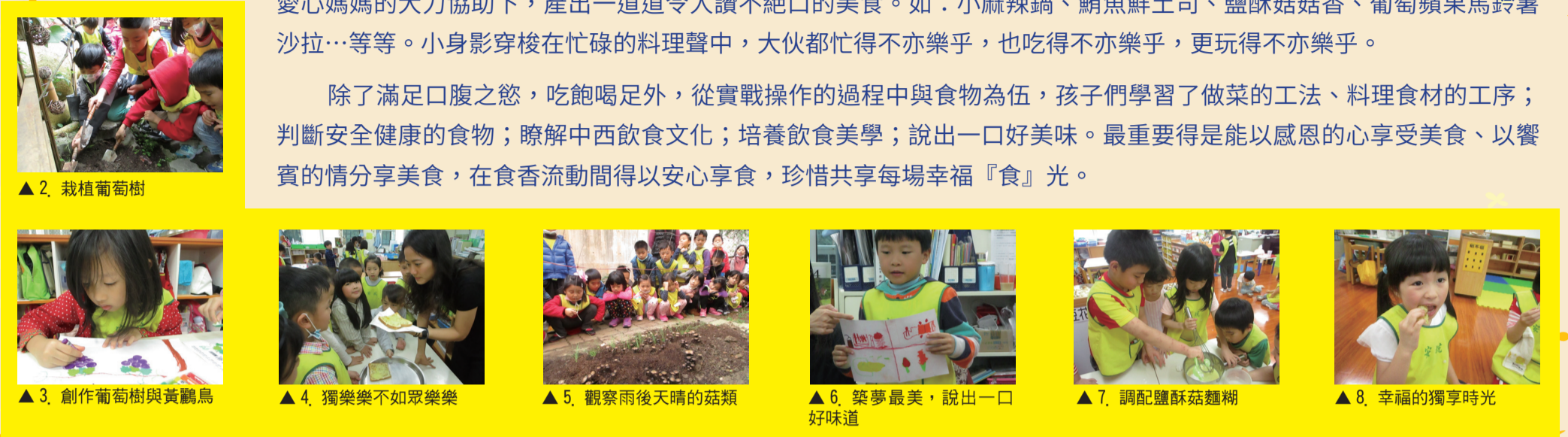
▲1. 觀察葡萄樹與爬藤植物 ▲2. 栽植葡萄樹 ▲3. 創作葡萄樹與黃鸝鳥 ▲4. 獨樂樂不如眾樂樂 ▲5. 觀察雨後天晴的菇類 ▲6. 築夢最美，說出一口好味道 ▲7. 調配鹽酥菇麵糊 ▲8. 幸福的獨享時光

除了滿足口腹之慾，吃飽喝足外，從實戰操作的過程中與食物為伍，孩子們學習了做菜的工法、料理食材的工序；判斷安全健康的食物；瞭解中西飲食文化；培養飲食美學；說出一口好美味。最重要得是能以感恩的心享受美食、以饗賓的情分享美食，在食香流動間得以安心享食，珍惜共享每場幸福『食』光。