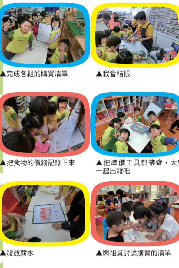
▲完成各組的購買清單 ▲我會結帳 ▲把食物的價錢記錄下來 ▲把準備工具都帶齊，大家一起出發吧 ▲發放薪水 ▲與組員討論購買的清單

食在有趣的課程，和孩子決定要一起出門買食材後，我們設計了一連串的課程，讓孩子能真的“自己靠自己”完成購買的活動。在一開始的活動中，先透過影片及宮廷年糕的食譜，讓孩子觀察需要的食材，並設計了年糕購買清單（包含：學校中已有的材料、可從家中準備的食材及需購買的食材），讓孩子依照小組的個別需求，討論出適合自己的購買清單。