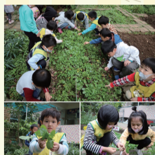
▲1. 眼力大考驗 - 找找黃鶉菜在哪裡？

「努力探索與尋找，發現野菜是個寶」，繼上學期認識、品嚐校園裡的野菜後，找尋與觀察農場裡的野菜已是葡萄班的日常。這學期大家發揮巧思嘗試做出不同的創意料理～有黃鶉菜煎餅、鼠麴草湯圓、野菜壽司…，製作料理過程中是希望大家玩得開心、吃得滿意、盡情享受探索的樂趣。歷經幾次校園除草，發現我們視為珍貴的「野菜」，卻是大家眼中的「雜草」，進一步的探究後了解到，自然環境中生長的野菜會影響主要作物的生長，就像為了保護我們的野菜，也會進行除草工作一樣。研究與認識野菜最終目的，並不是因為想吃而摘採它，而是希望因為認識這些「野菜」，可以發現更多被遺忘在角落的植物，走出戶外時能夠增添不同的生活樂趣，玩出幸福感且甜甜的味道！