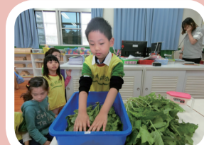
▲4. 製作許多蘿蔔料理。

在大家合力除草整地之後，我們種下了花生。初期，我們的花生苗一直被鳥兒吃掉，只剩下幾棵存活，後來換了移植的方法，終於花生慢慢長大了，也開了黃色的小花。我們期待花落之後，就會有好事發生。