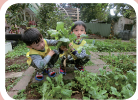
▲1. 在學校種的蘿蔔小小的。