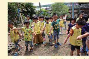
▲8. 探究 - 為什麼我們的野菜不見了