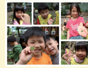
▲7. 淺藏愛意的酢漿草帶來甜甜的味道