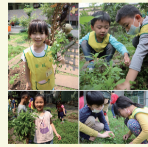
▲3. 保護野菜，除去我們認為的雜草。