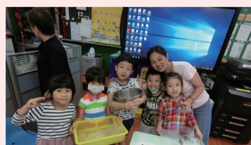
▲分送食物給大家試吃！

經過兩天的宣傳練習，孩子們開始對宣傳的內容有了些許的概念，並且進行台詞的分配，練習時台下的同學和老師一直念著：「不要緊張、大聲一點…」踏出教室孩子們既興奮又緊張，鼓起勇氣邀請大家來奇異果班吃東西，這都是孩子們自己製作的食物喔！試吃大會當天，熱情的葡萄班湧進奇異果班教室，觀摩哥哥姐姐們製作料理，我們的料理分成三組，煮咖哩、攪拌沙拉和包飯糰，甜鹹手抓飯剛剛好完成了，葡萄班的弟弟妹妹自行選擇喜歡的口味，並排隊領取手抓飯糰，葡萄班弟弟妹妹一口吃下，馬上送給奇異果一個讚，最後，我們還將製作好的食物分送到各班品嘗，奇異果試吃大會成功！！