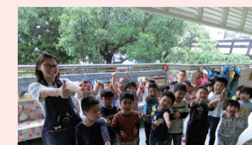
▲葡萄班覺得超級好吃！