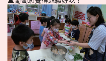
▲請老師吃著鹹的手抓飯！