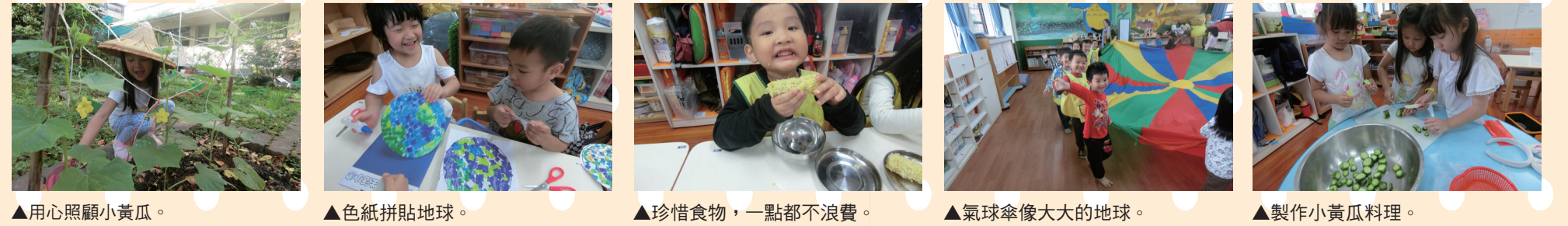
▲用心照顧小黃瓜。 ▲色紙拼貼地球。 ▲珍惜食物，一點都不浪費。 ▲氣球傘像大大的地球。 ▲製作小黃瓜料理。

「食」在「友」趣這個主題中，我們討論了許多「友」善對待環境的方式。同時，也在4月22日這天，介紹了世界地球日，透過繪本的引導，關注全世界環境保護議題，讓孩子們更能感受自身與環境的關係。我們一起唱著「地球的孩子」，了解這麼美麗的星球只有一個。看到海龜誤食塑膠袋的影片，孩子們除了震驚外，也紛紛地說海裡的垃圾是人類丟的，我們不能這樣。於是，柚子班開始我們的綠色生活運動：吃當季本地食材；種植有機小黃瓜；減少垃圾量，確保每張衛生紙都沒有浪費；節約用水；做好資源回收；將大小的衣服再製作成環保袋；重複使用塑膠袋...小小的環保種子，也能有大大且不容忽視的力量喔！