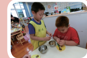
8. 練習剝花生殼，並創作。