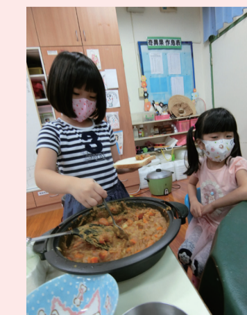
▲咖哩三明治的最後一個步驟。