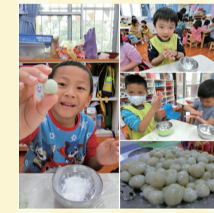
▲5. 創意料理 - 鼠麴草湯圓大成功。