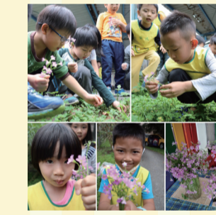
▲6. 摘採美麗的紫花酢漿草插在花瓶裡