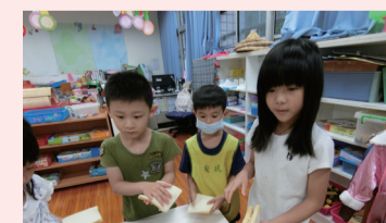
▲馬鈴薯沙拉三明治！