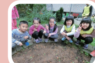
▲7. 觀察花生長出幼苗了！