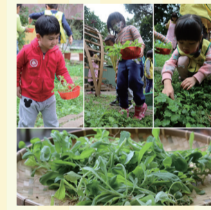
▲4. 採收季節性野菜 - 鼠麴草。