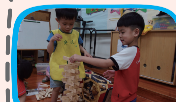
▲哥哥帶來玩具好玩喔！