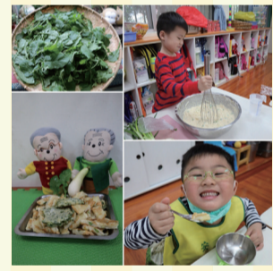
▲2. 一片接一片美味的黃鶉菜煎餅。