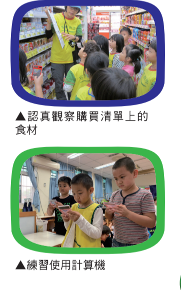
▲認真觀察購買清單上的食材 ▲練習使用計算機

從認識製作過程、分組討論購買清單一直到實際到大美超市挑選，孩子在整個過程中，學習實際去選擇食材、觀察價錢、練習使用計算機、計算錢夠不夠、討論錢不夠的解決辦法、學習紀錄價錢、計算花費、自己提食材、自己收錢、整理購物所需要的東西等等。我們一起度過了愉快又充實的一天。