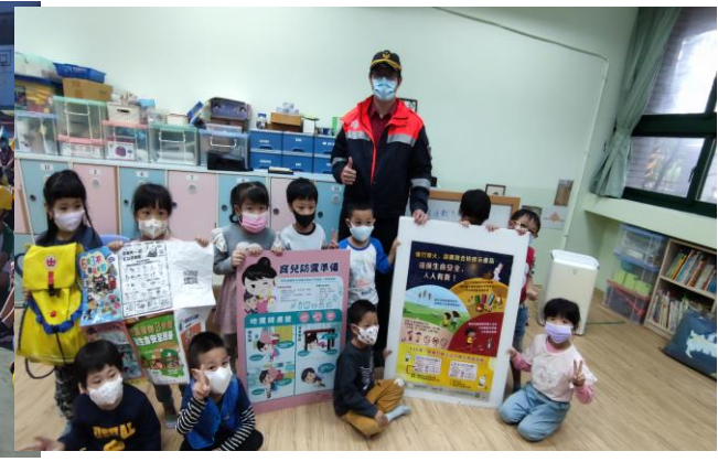
112. 9. 21 防災教育主題宣導 112. 9. 21 防災教育主題宣導