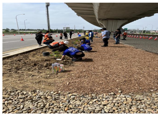
學生認識樹種並且種植糊標