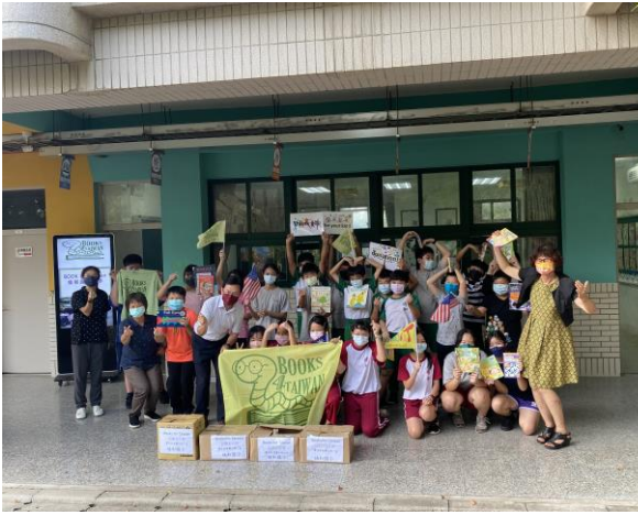
學生開心收到國外船運過來的書籍