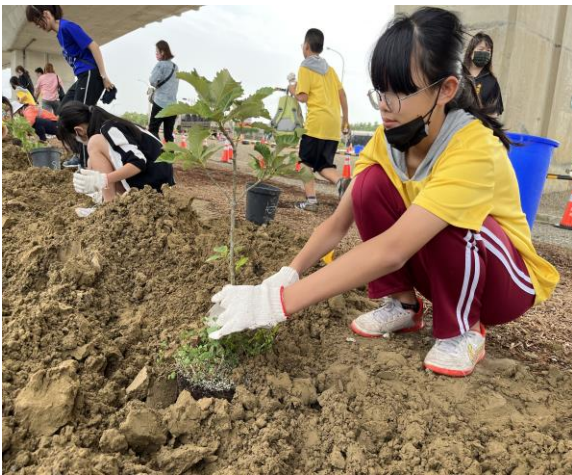
學校與公路局合作，種特有種糊標