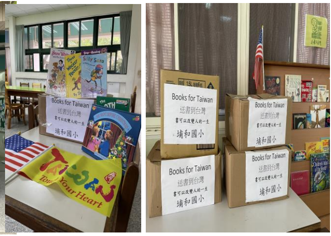
Book for TAIWAN