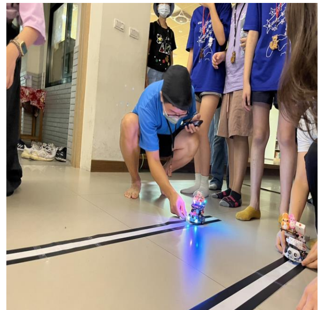
111. 10. 11 數位深耕 SDGs 活動