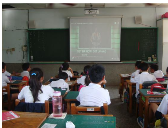
觀賞影片「媽媽之歌」