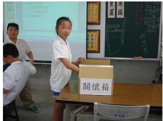
學生從「關懷箱」抽取學習單