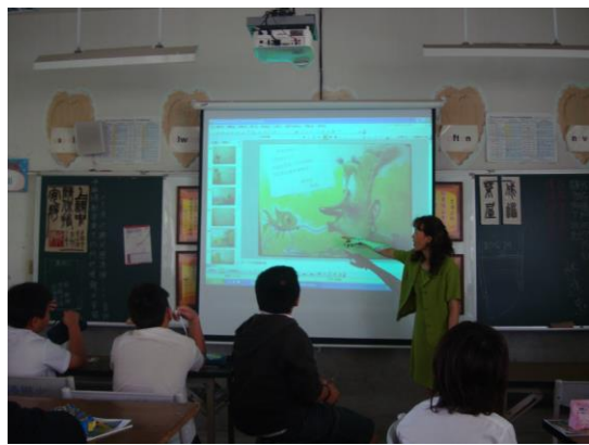
繪本導讀「我要大蜥蜴.ppt」