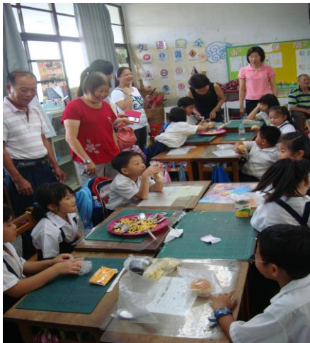
親子共同製作「愛的早餐」