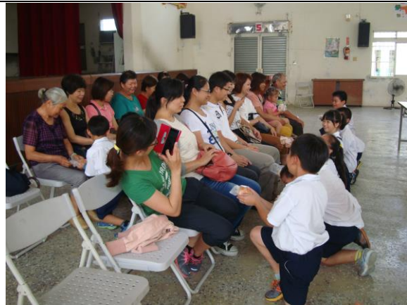
孩子恭敬的奉上「愛的早餐」