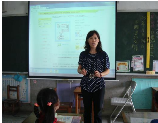
老師說故事「貓媽媽的早餐」