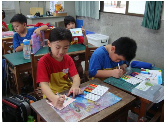
學生製作「愛的邀請卡」