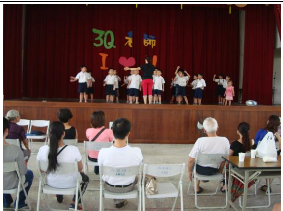
家長欣賞孩子表演「感恩的心」