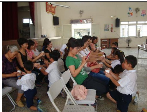
孩子恭敬的奉上「紅茶」