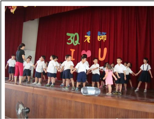
孩子表演「感恩的心」