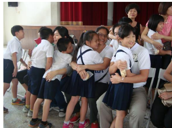
家人給孩子《愛的擁抱》