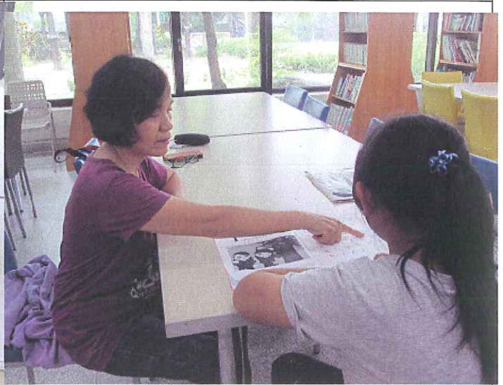
活動照片 2：拼音教學