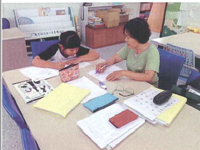
活動照片 3：聽寫練習