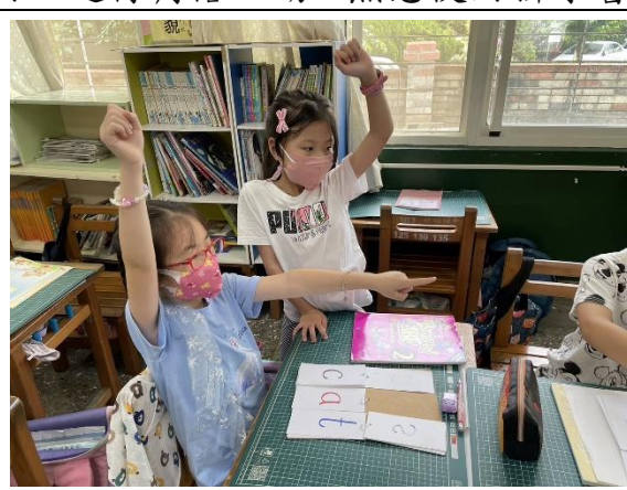
說明：兩人一組使用老師自製的拚讀本