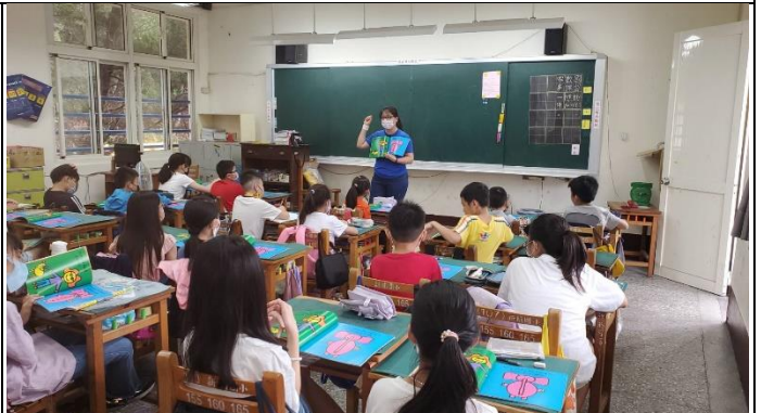
說明：跟著老師練習說出故事的基本句型