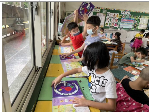
說明：進行角落活動：熟悉使用拼字書