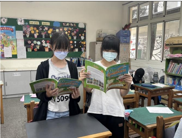
說明：兩人一組擔任同一角色