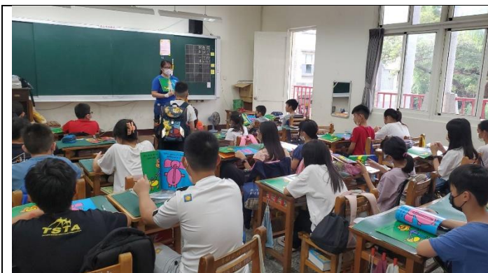
說明：同學演出書中特殊的角色