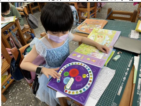
說明：下課仍然愛不釋手，轉著唸字母