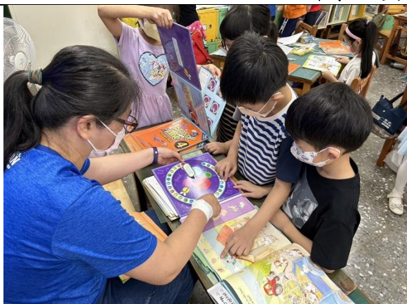
說明：老師示範操作神奇轉盤拼字書