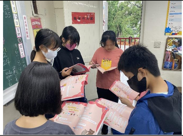
說明：練習劇本中的台詞