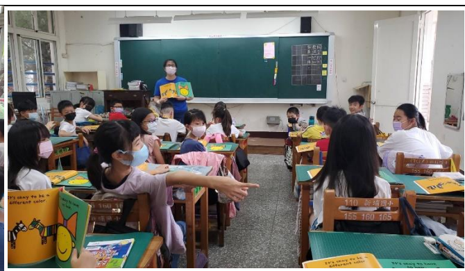
說明：說出並指出最特別的同学