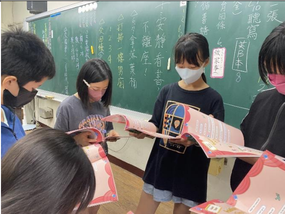
說明：進行第一次讀者劇場演練