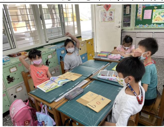
說明：最快拚對並說出答案的組別加分