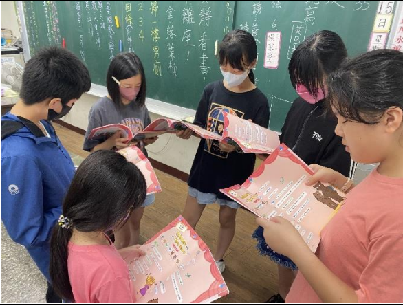
說明：小組討論角色分配