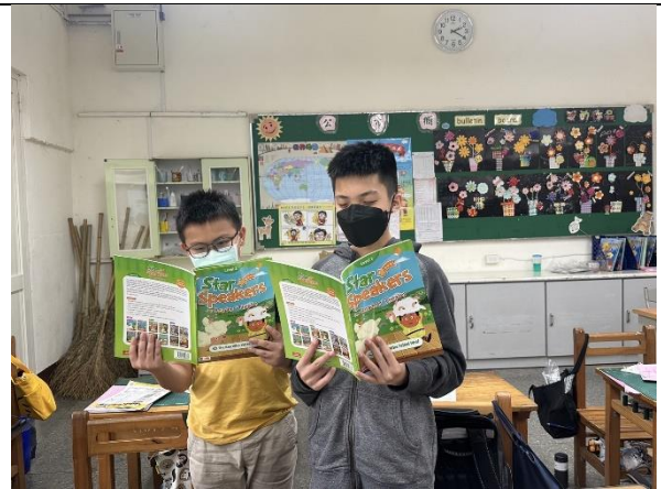
說明：劇本台詞的情感及音量練習