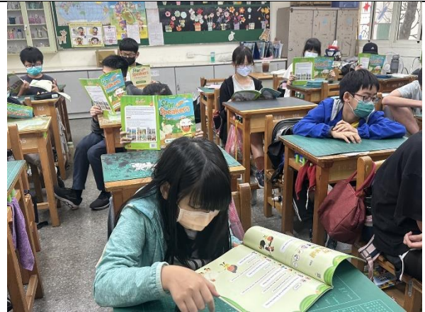
說明：個人閱讀劇本中角色的台詞