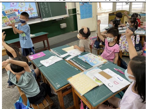
說明：小幫手公佈書本中的答案