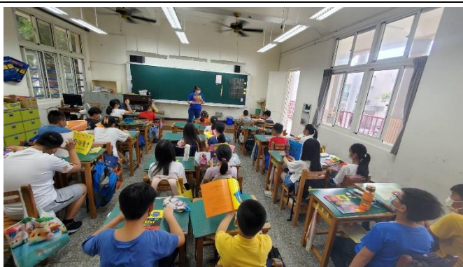
說明：用一個英文字說出對封面的想法