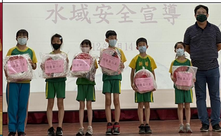
說明：榮獲特優第一、二名各班長代表領獎