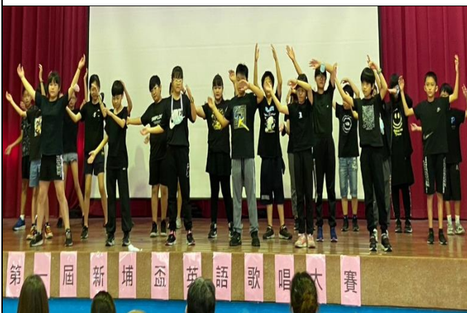
說明：五丁熱情如火的英語組曲表演