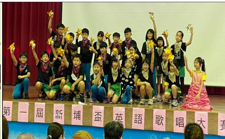
說明：三甲的閃閃 little star