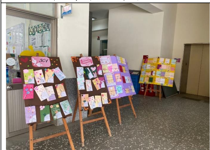
說明：五年級呈現特色主題立體卡片