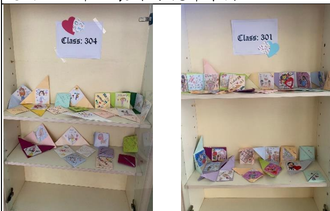
說明：三年級製作摺紙卡片