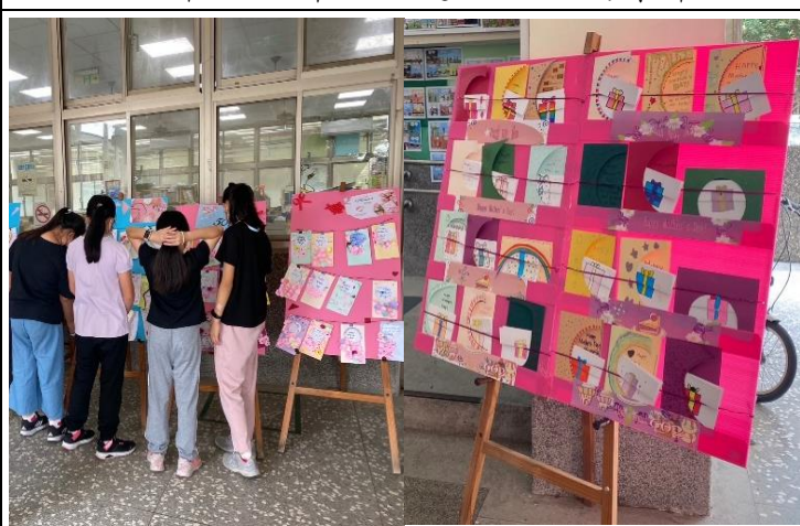
說明：六年級的創意卡中卡(母親節賀卡)