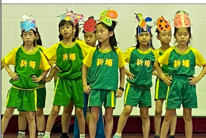
說明：低年級戴著可愛頭套演唱字母歌