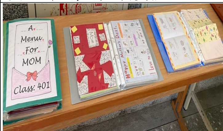
說明：四年級設計一份送給媽媽的菜單