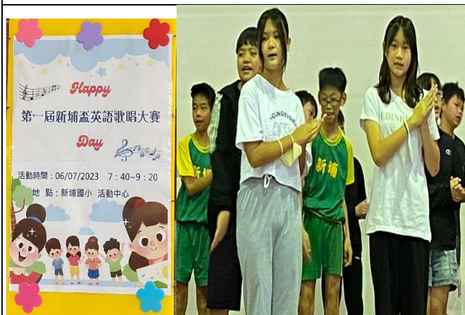
說明：歌唱大賽海報及六年級最後的比賽