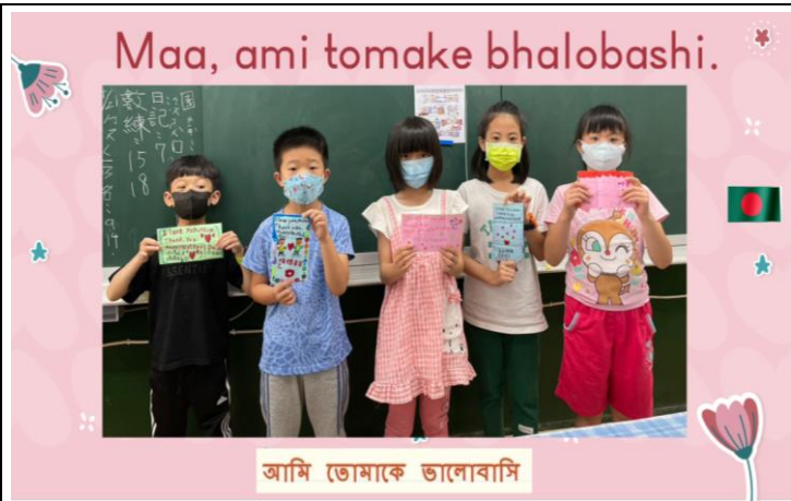
說明：二年級寫一封給母親的信