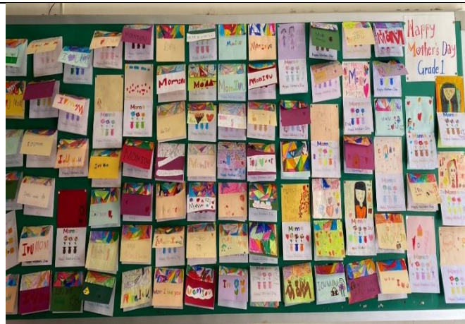
說明：一年級製作母親節卡片