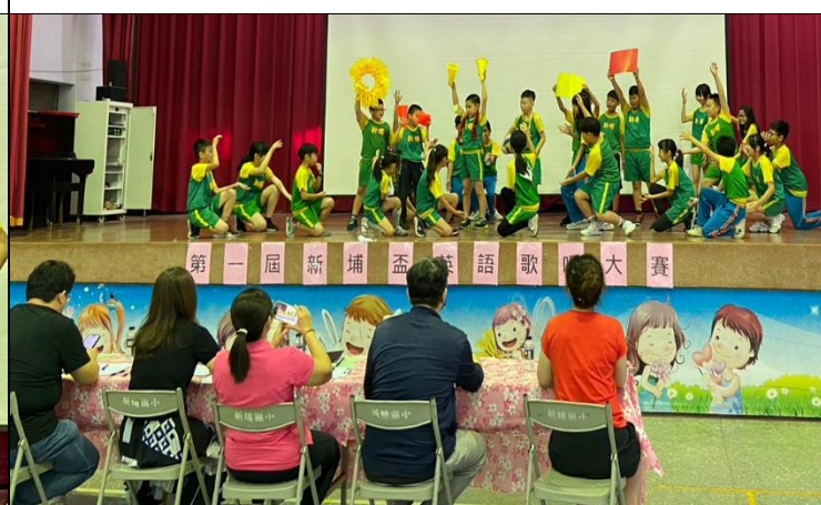
說明：魅力四射 Wakka wakka 的四乙