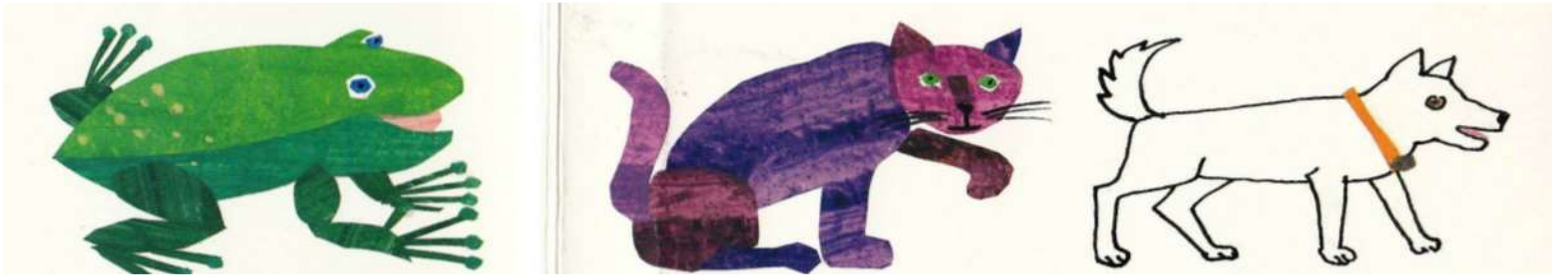
a green frog