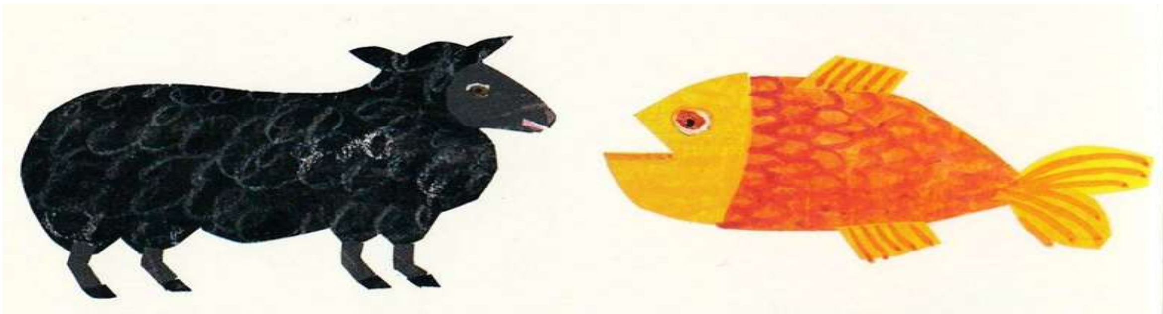
a black sheep