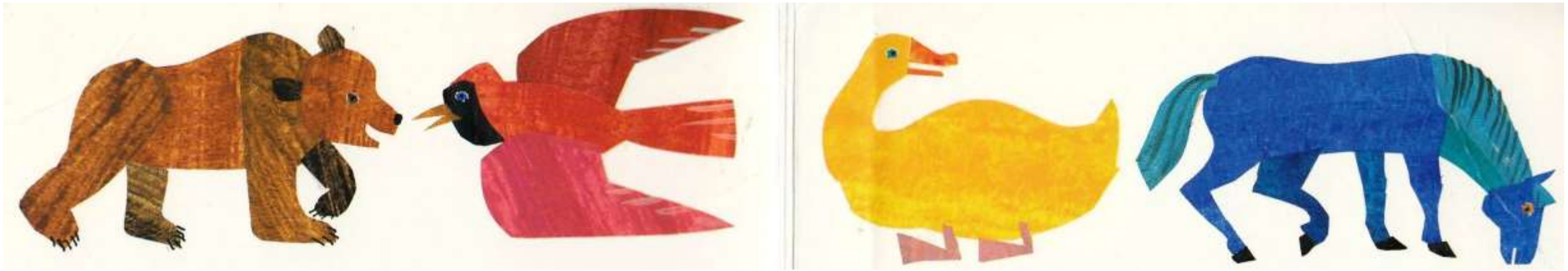
a brown bear