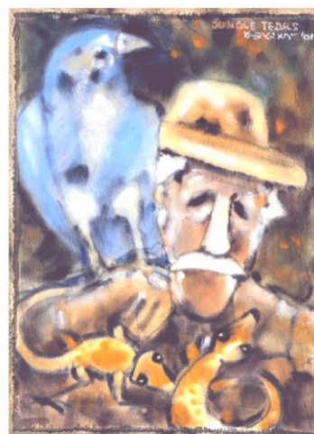
↑ 圖 A

★【問題 1】請在展覽中找到圖 B 這幅作品，算算看總共有幾隻小瓢蟲呢？_____。牠們圓圓的身軀分別有那些顏色_____；小瓢蟲