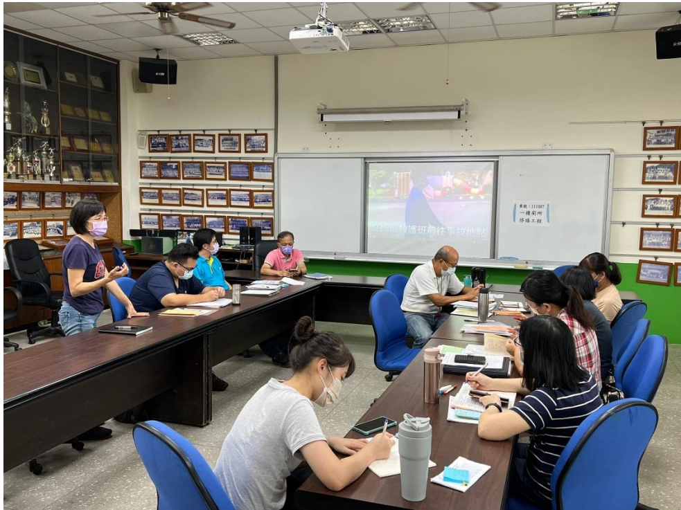
說明：說明本年度環境教育推動之重點工作