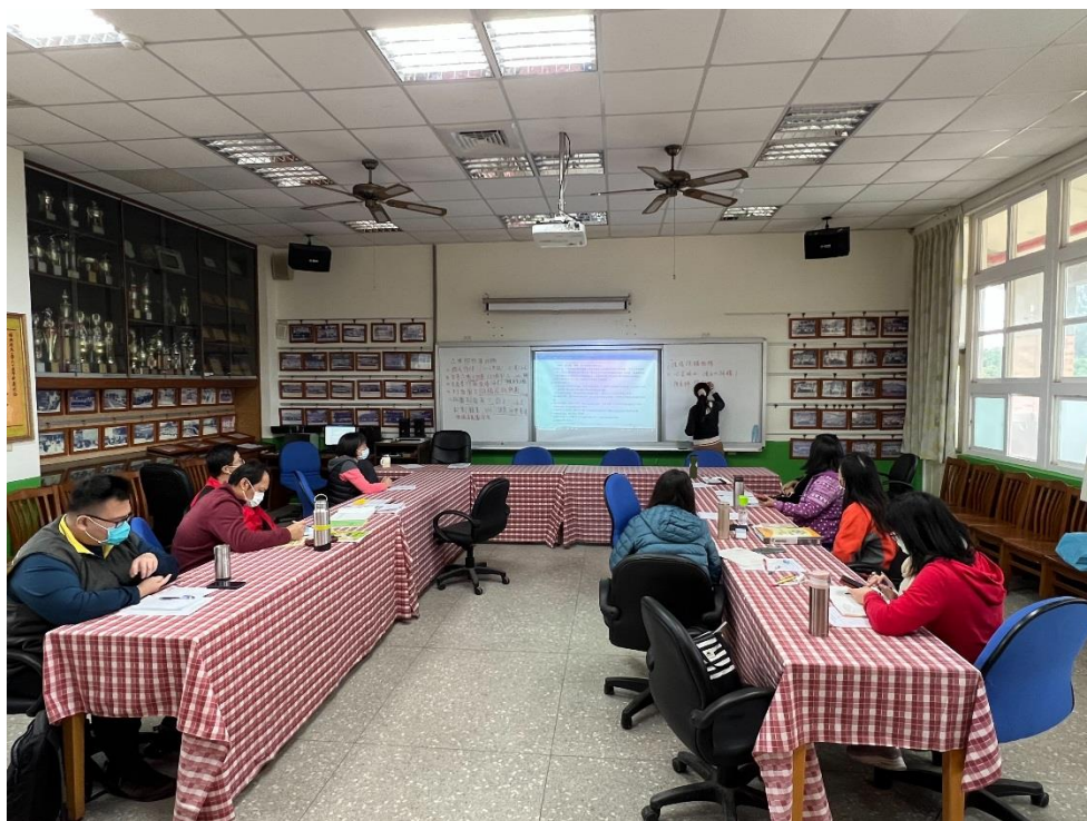
說明：說明環境教育推動行政與教學並重