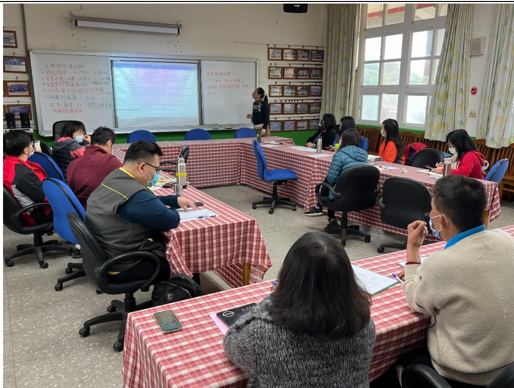
說明：教師說明本年度環境教育融入課程教學相關之重點