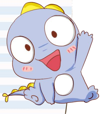
Illustration by MINAKO OGAWA