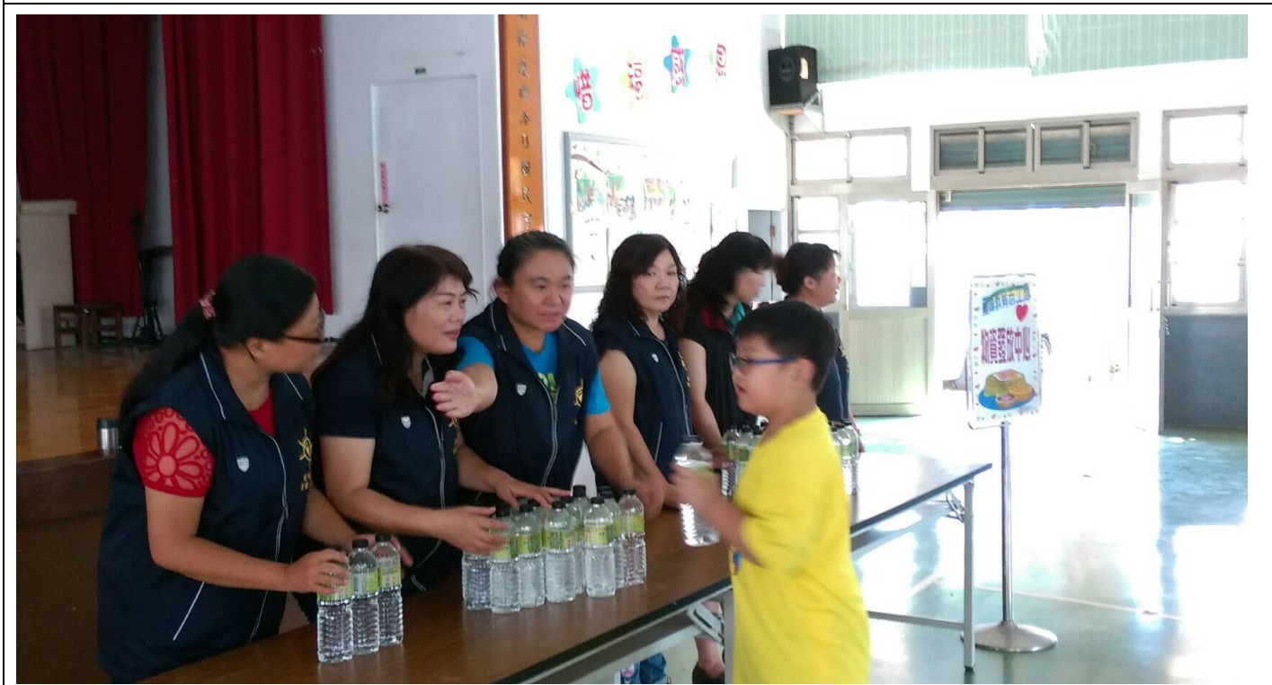
結合社區志工辦理宣導演練