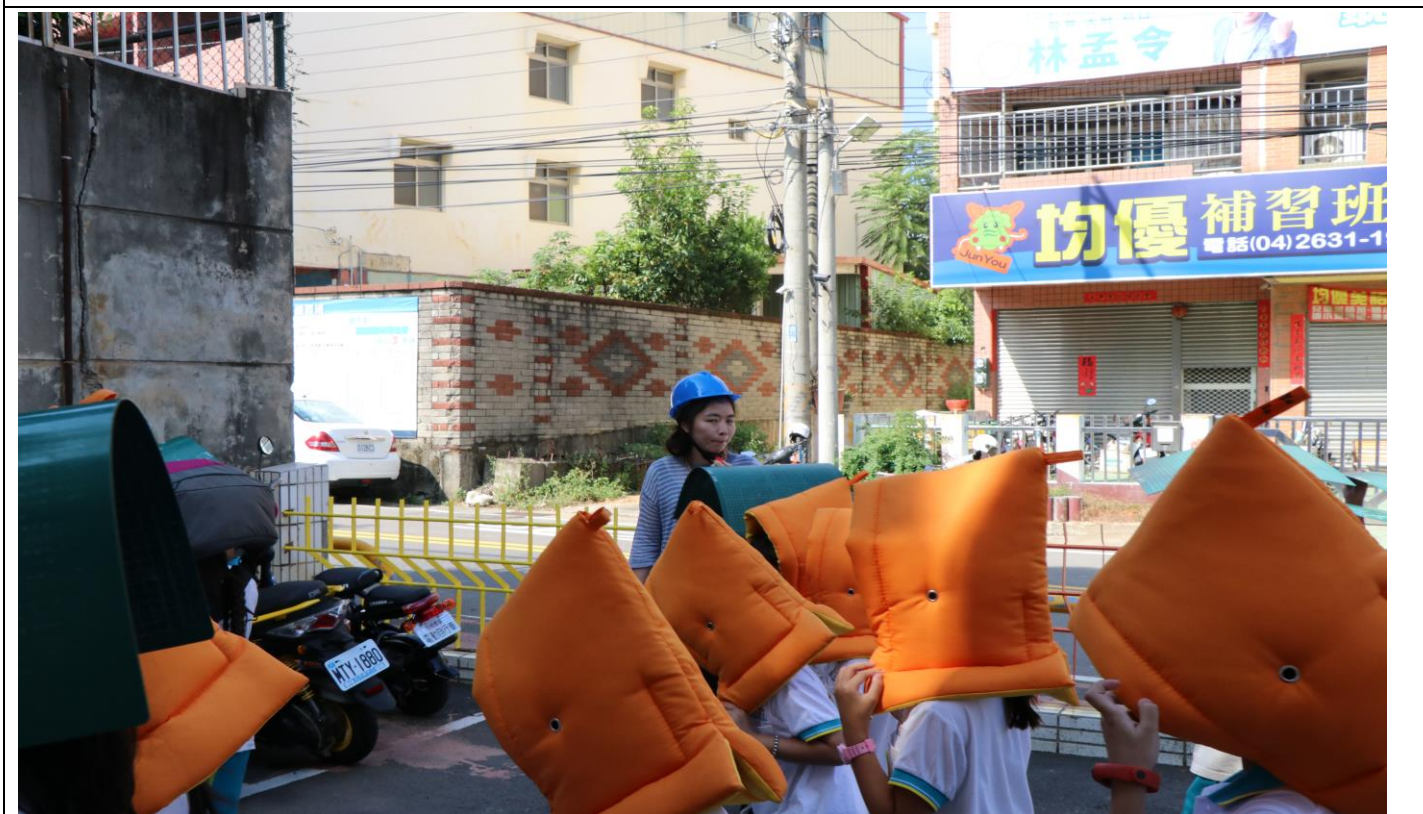
防災教育實地演練—(921 國小教師引導疏散)