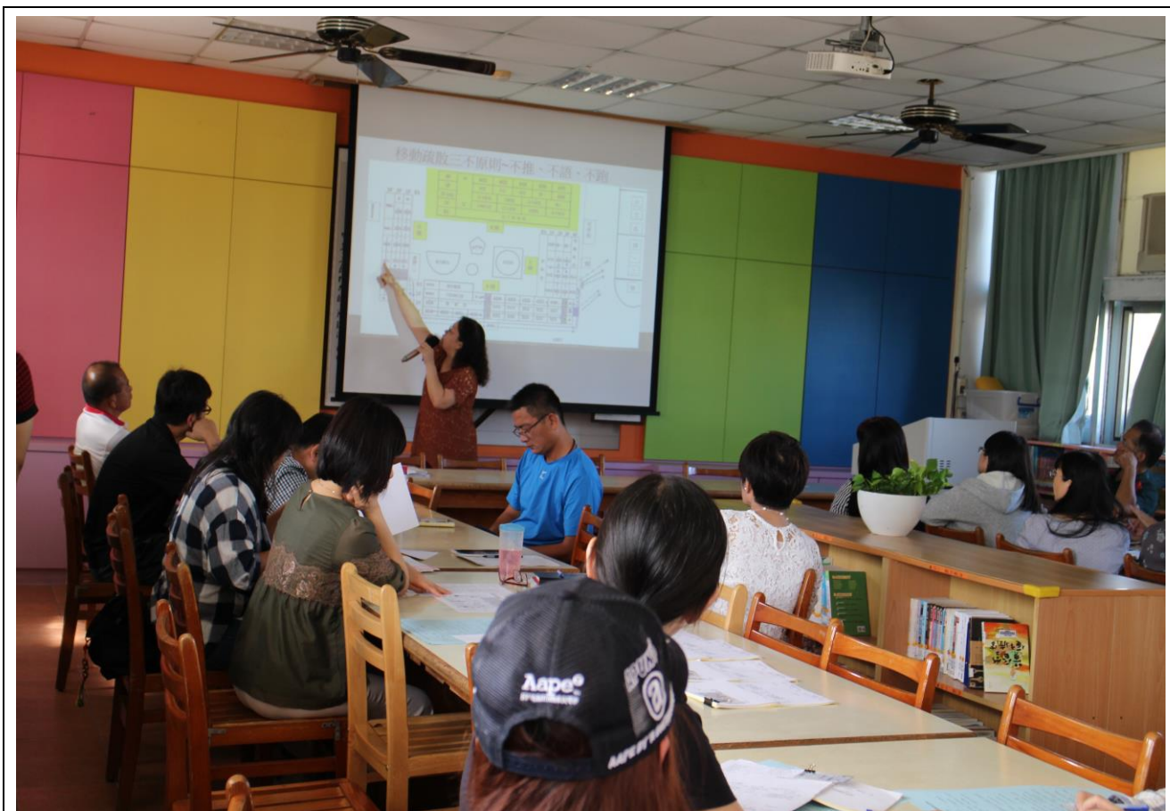
防災教育教學與宣導—(教師晨會)