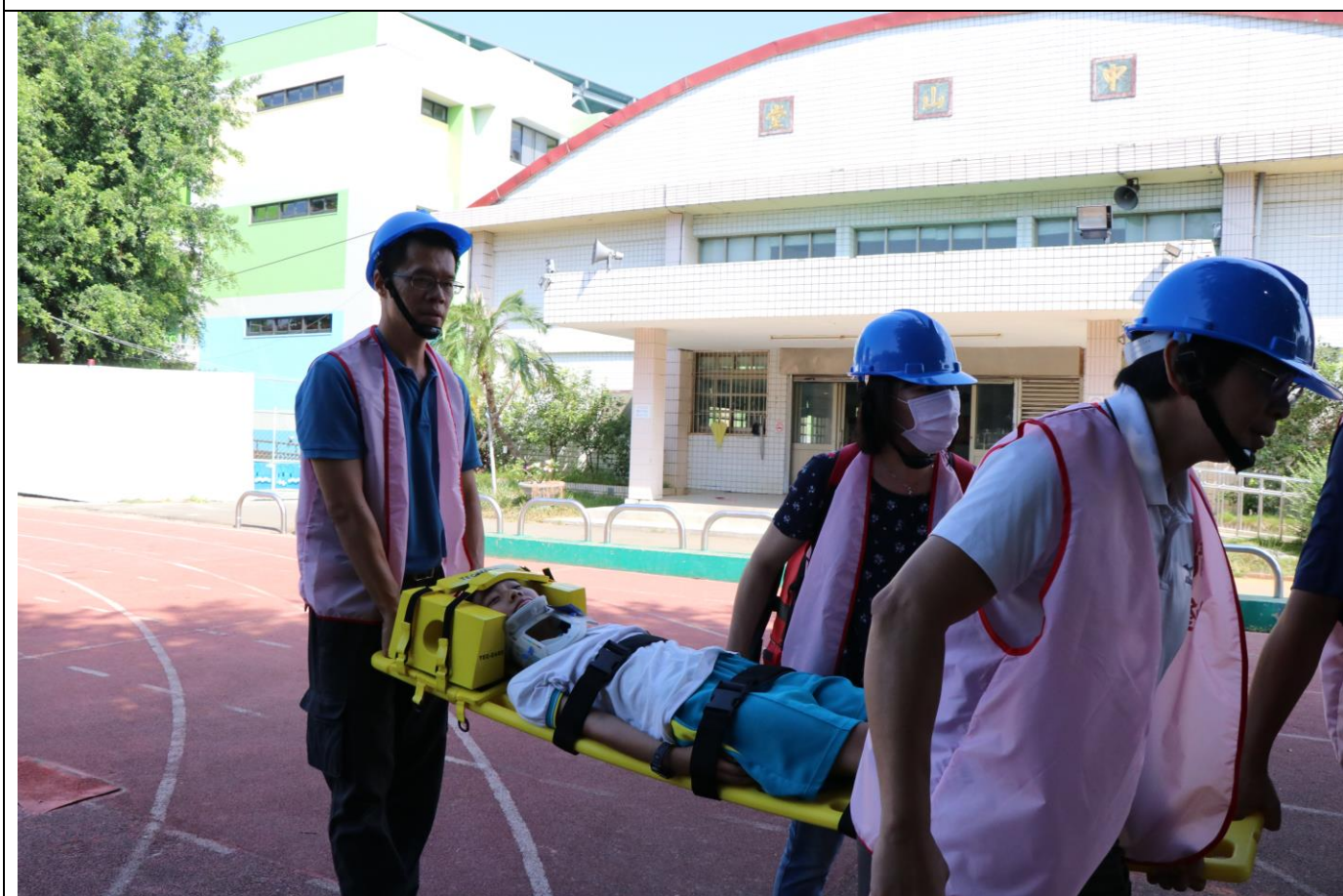
受傷學生醫護處理演練—(921)