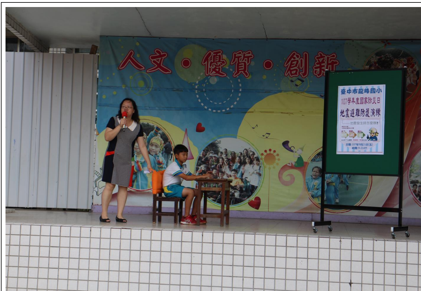
防災教育教學與宣導—(學生朝會)