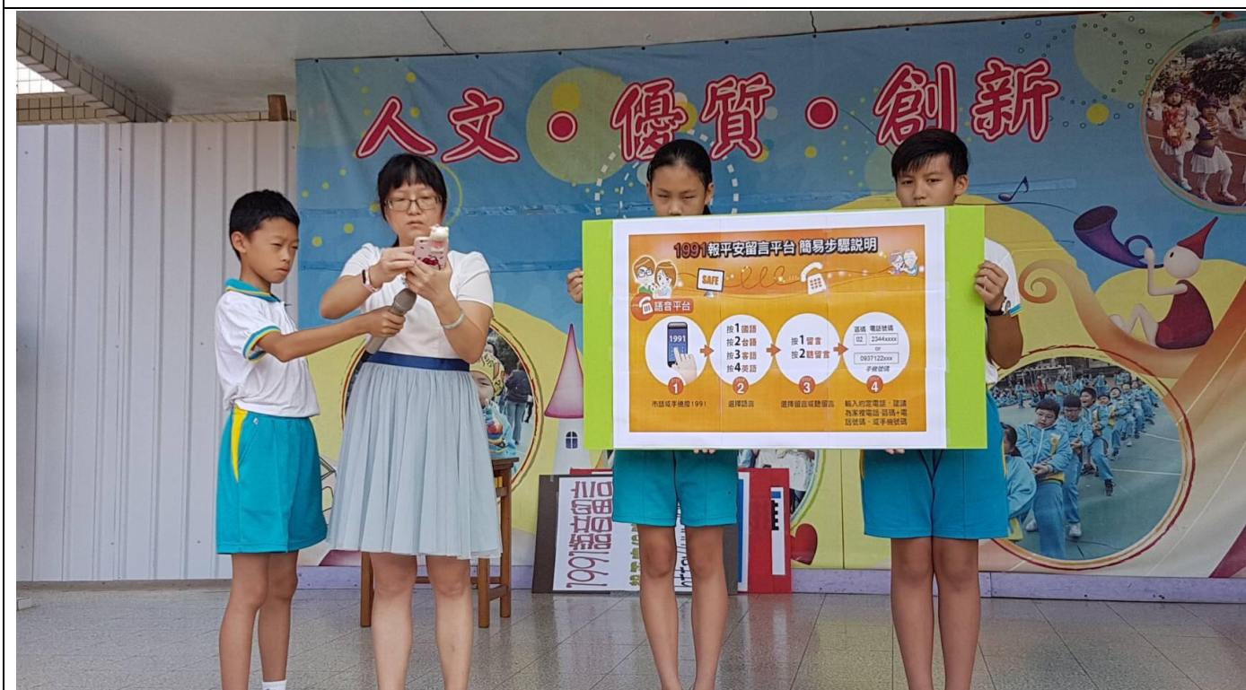
防災教育教學與宣導---(學生朝會)