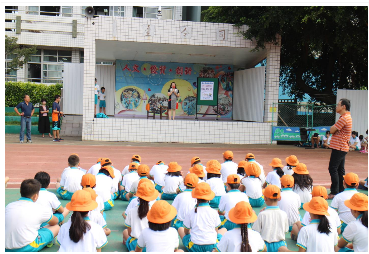
防災教育教學與宣導—(學生朝會)