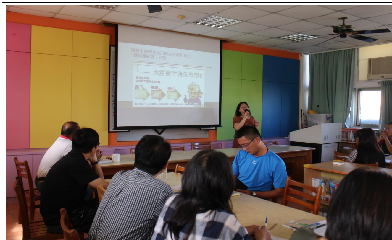
防災教育教學與宣導—(教師晨會)滑