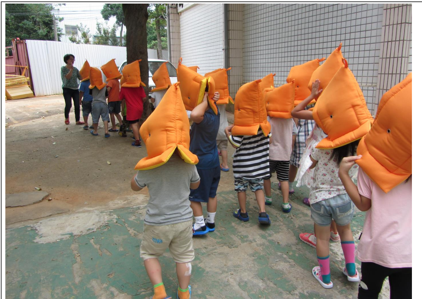
防災教育實地演練—(921 幼兒園教師引導疏散)