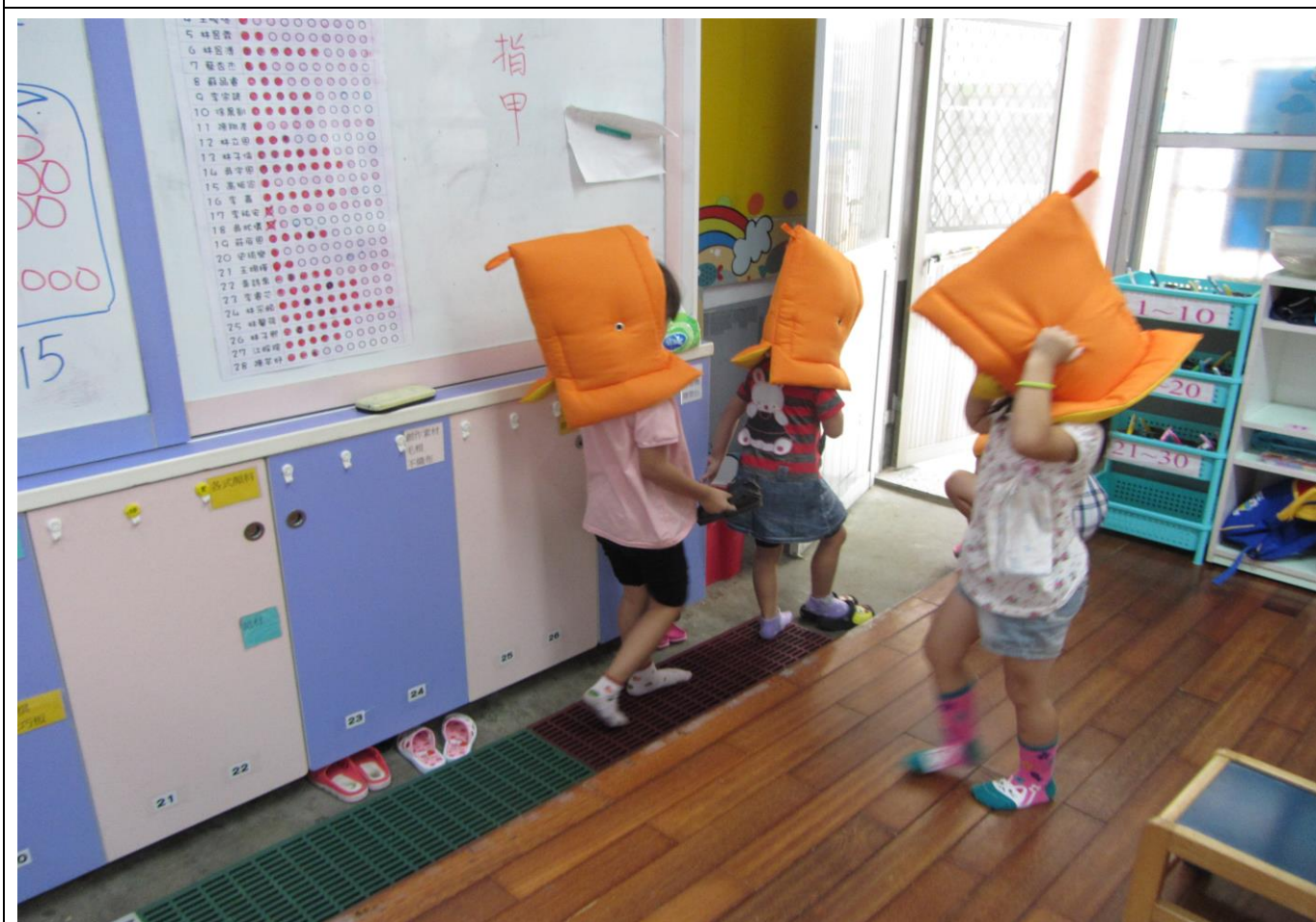
防災教育實地演練—(921 幼兒園)