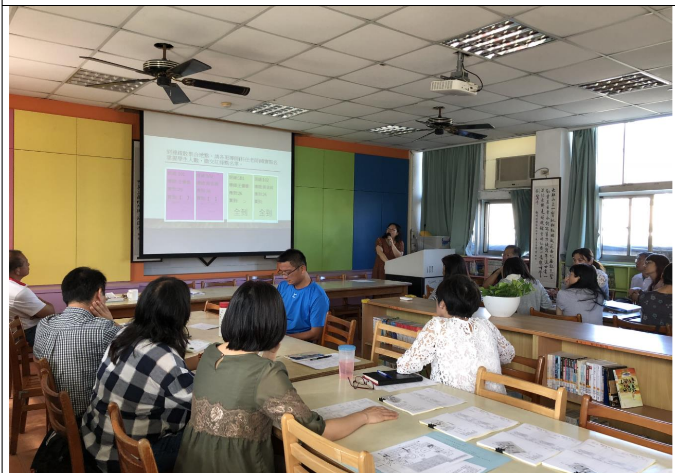
防災教育教學與宣導---(教師晨會)