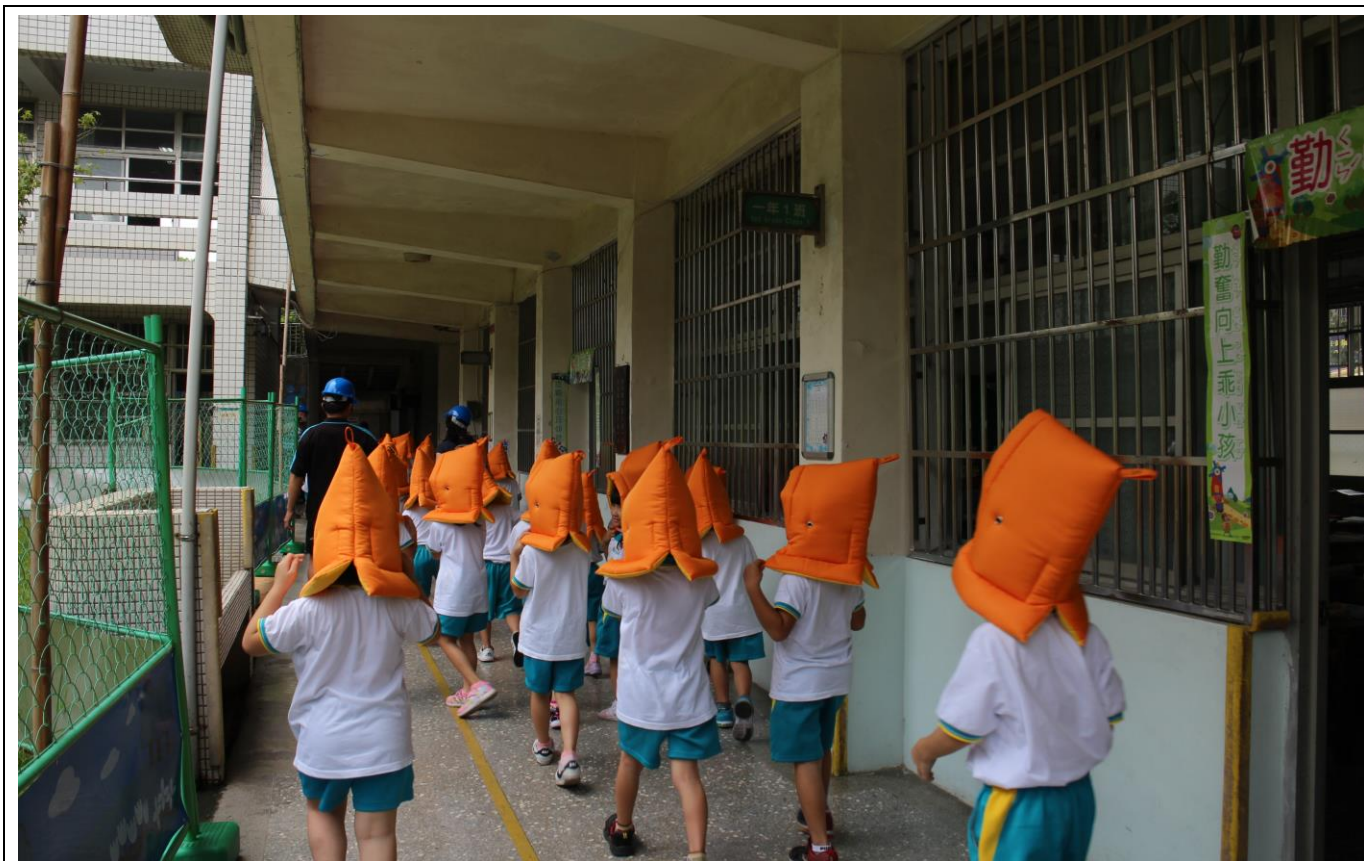
防災教育實地演練—(921 國小)