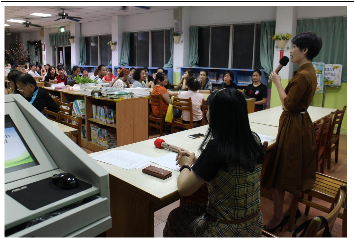
防災教育宣導-班親會