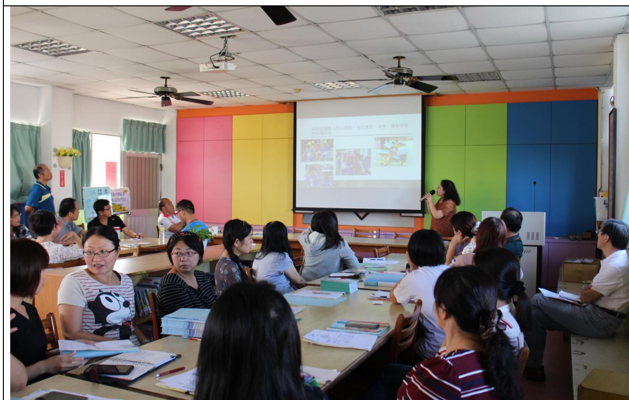
防災教育教學與宣導---(教師晨會)