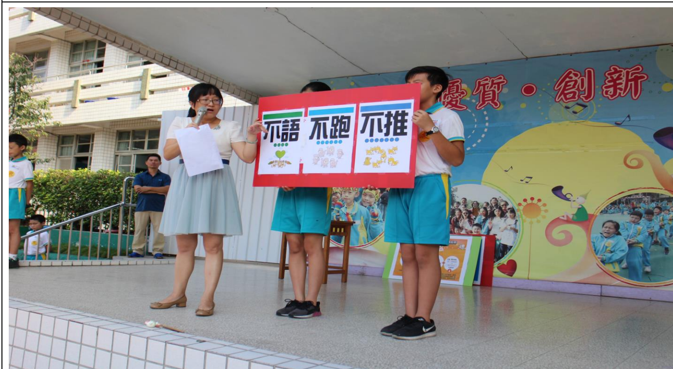
防災教育教學與宣導---(學生朝會)