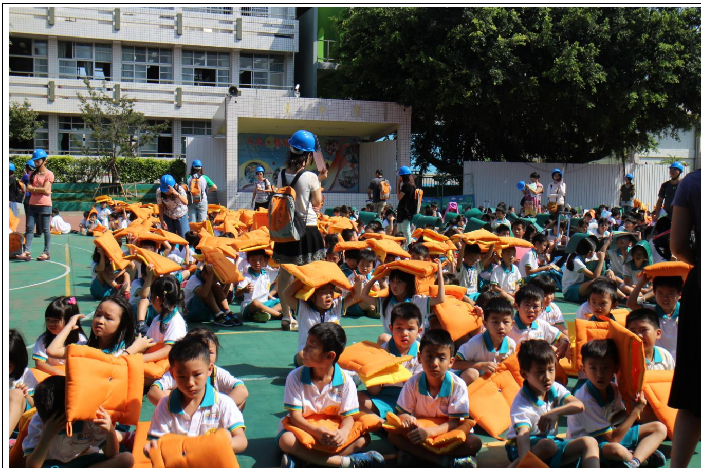
防災教育實地演練—(921 疏散至集結點)