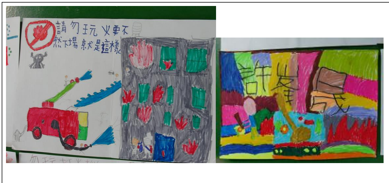
說明：1050305 防火繪畫比賽作品