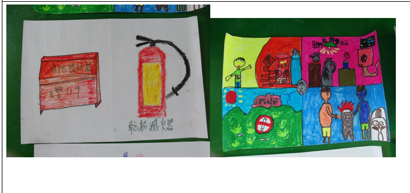
說明：1050305 防火繪畫比賽作品