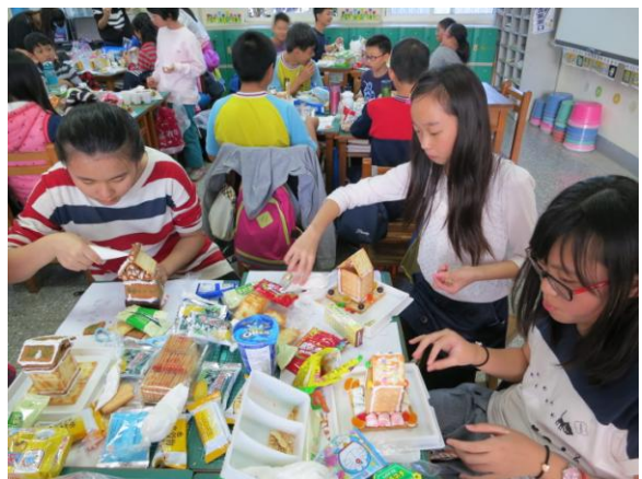
↑ 薑餅屋製作，好歡樂呀！