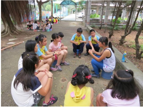
↑國中畢業的學長姐，回到母校與我們話家常，也聊聊學習規劃。