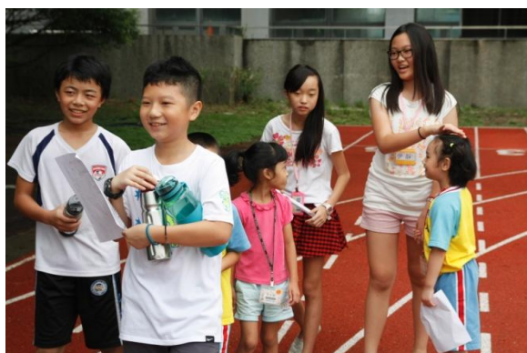
↑一年級小朋友們，個個天真又可愛！