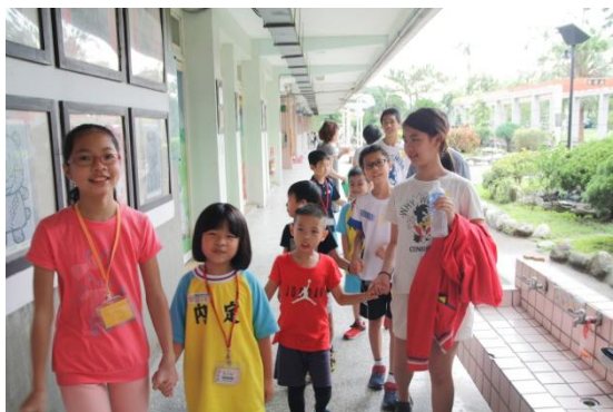
↑大手牽小手，認識校園趣。