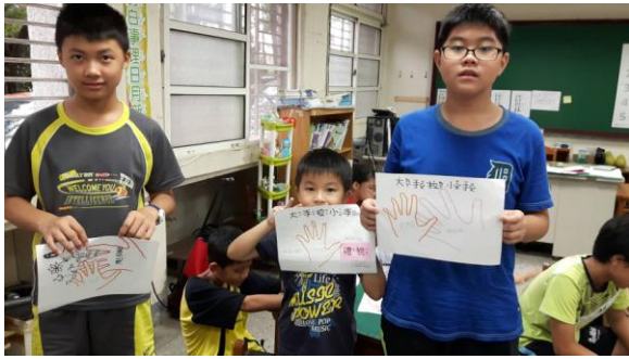
←↙↓大手牽小手，畫你手畫我手