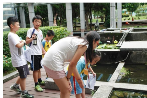
↑哥哥姐姐們，熱心又有耐心的帶著一年級小朋友們認識校園。