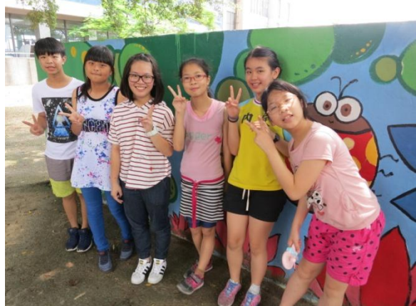
←↑學長姐特地回來與我們分享成長歲月，大家相談甚歡。