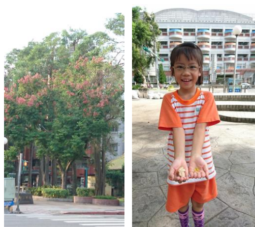
背後是校門口 知道樂樹在哪了嗎?