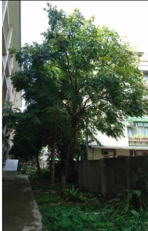
很難找的位置，在我們北棟教室窗外