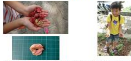
成熟蒴果苞片膨脹像燈籠掛在樹上。