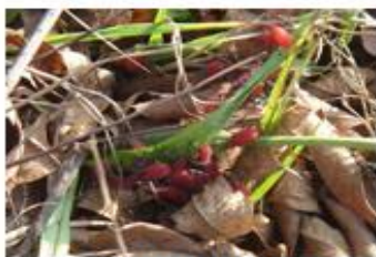
成群的紅燈籠梅象。