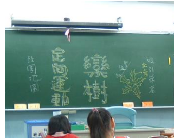
樂樹葉片跟聖誕紅葉片差異