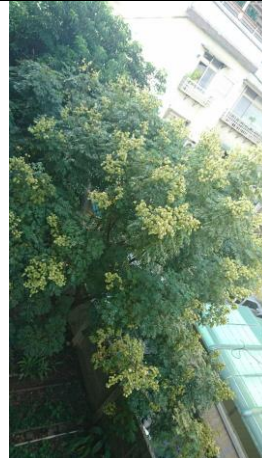
從我們(北棟)教室窗外看後花園