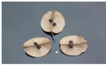
蒴果由三月合起，每月裡面有二顆種子。