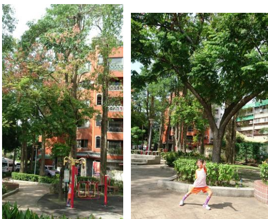
猜一猜 這棵樂樹在哪看過?