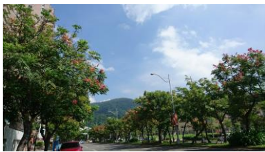
忠誠路的樂樹(新光三越前)