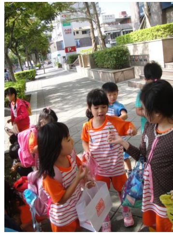
已關的誠品外人行道