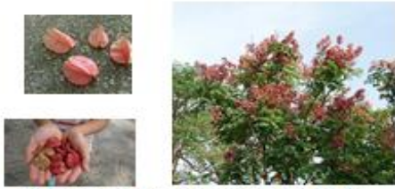
花期過後馬上長出紅色蒴果。