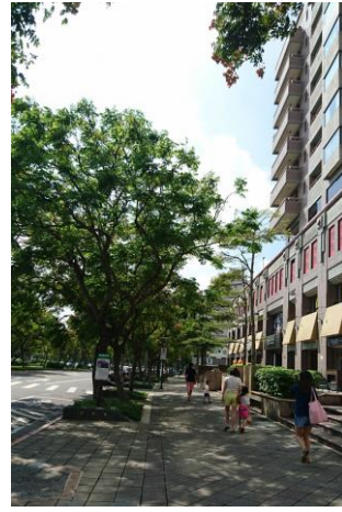
誠品書店關沒多久 現在還是可以乘涼