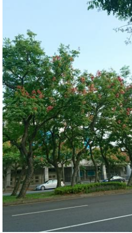
聽到打棒球聲音嗎?知道是哪了吧