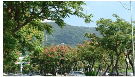
整條忠誠路的樂樹(運動公園前)