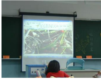
看圖想一想 為什麼叫做燈籠樹?