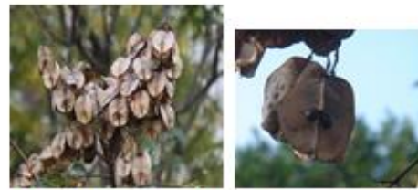
成熟的蒴果逆開後像小小面盆。