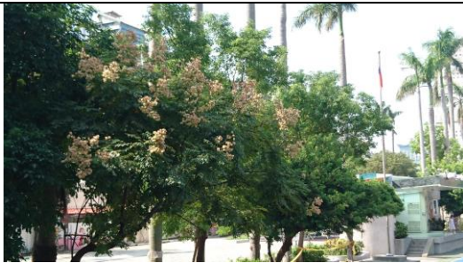
看到升旗台沒? 知道樂樹在哪嗎?