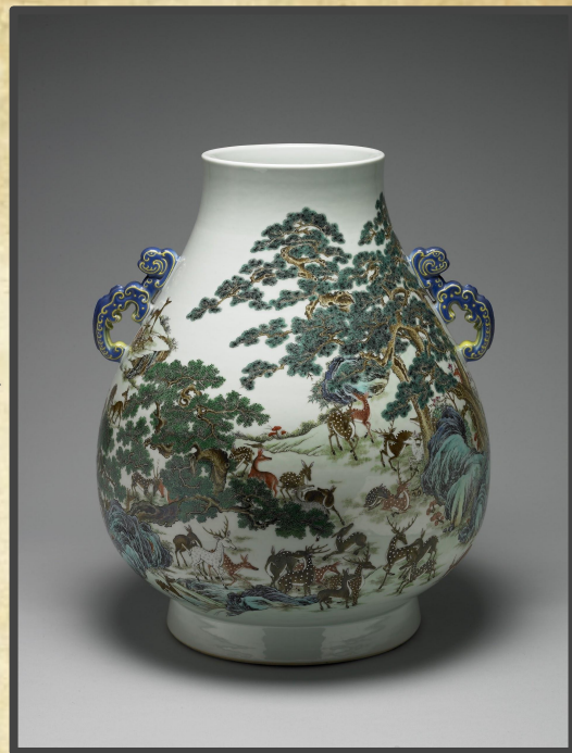
西元1738年 磁胎洋彩百祿雙耳