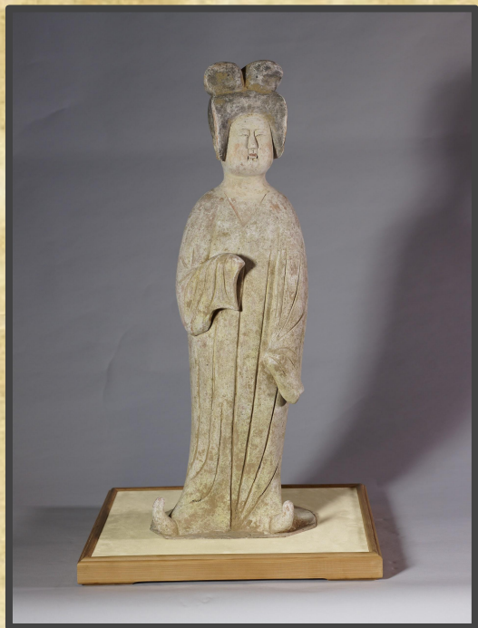
西元618~907年 灰陶加彩仕女俑