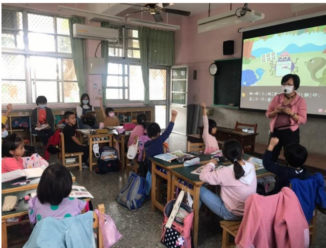
圖說：教師公開觀課

各班老師盡量以課文本位閱讀理解策略作為觀課主題，並定期聘請專家指導備觀議課工作坊。