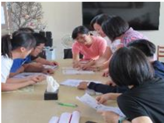
圖說：閱讀推動計畫研討

積極鼓勵教師參與閱讀教育工作坊、專業發展工作坊，擴展視野，分享閱讀教學經驗；教師參與各類型或領域的閱讀理解或閱讀教學相關研習，回校後與同仁分享，並討論不同閱讀策略適合之教學內容，讓參與成員進行各策略的教學經驗回饋，藉由腦力互相激盪，在研習後能將閱讀研習的所見所聞，落實實踐於課堂上的閱讀教學，在各個領域中融入閱讀，讓學生對該主題有更深入了解，另一方面教師也自我提升閱讀教學能力。