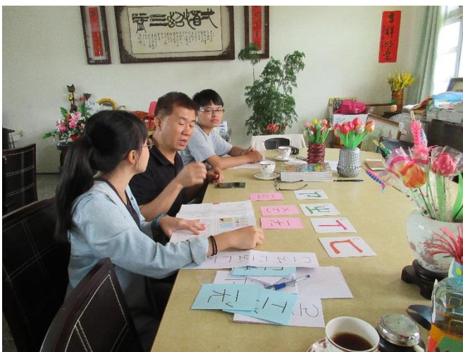
圖說：教師與外聘講師備課