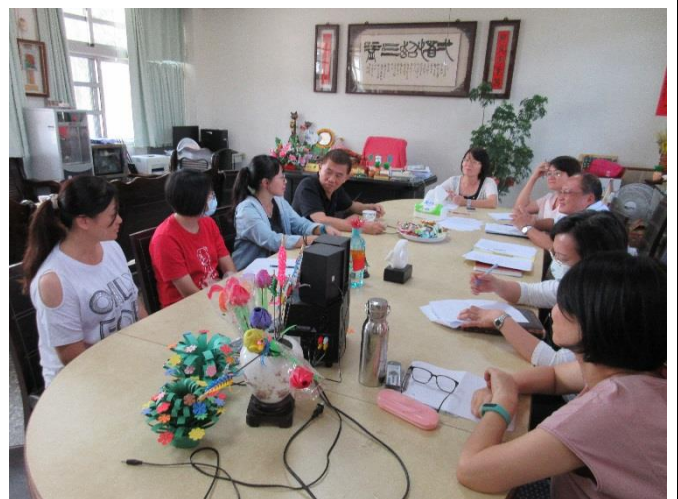
圖說：教師與外聘講師議課