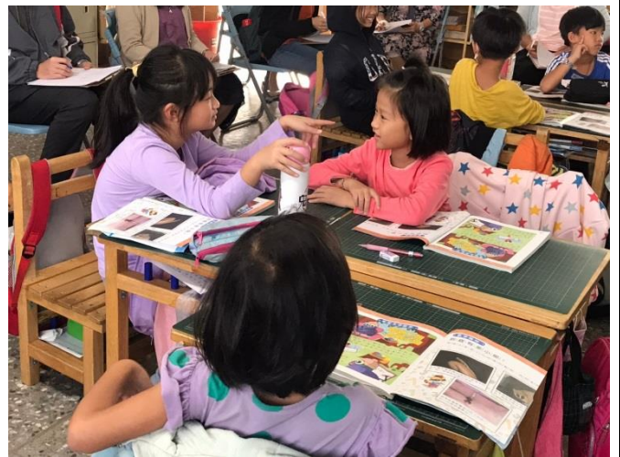
圖說：學生互相討論