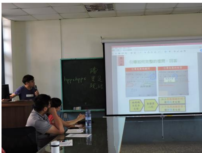
圖說：國語文閱讀理解策略分享