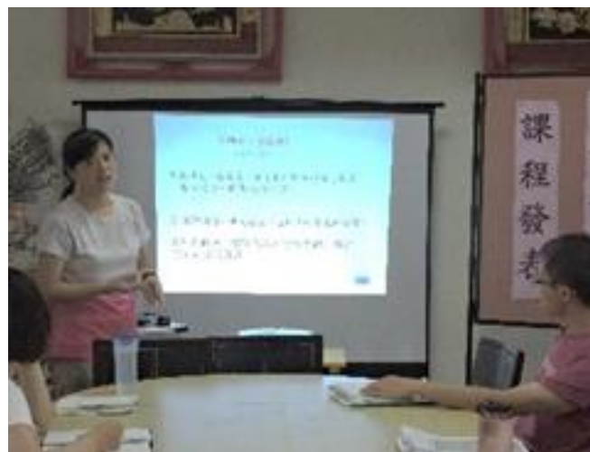
圖說：閱讀課程議題探討