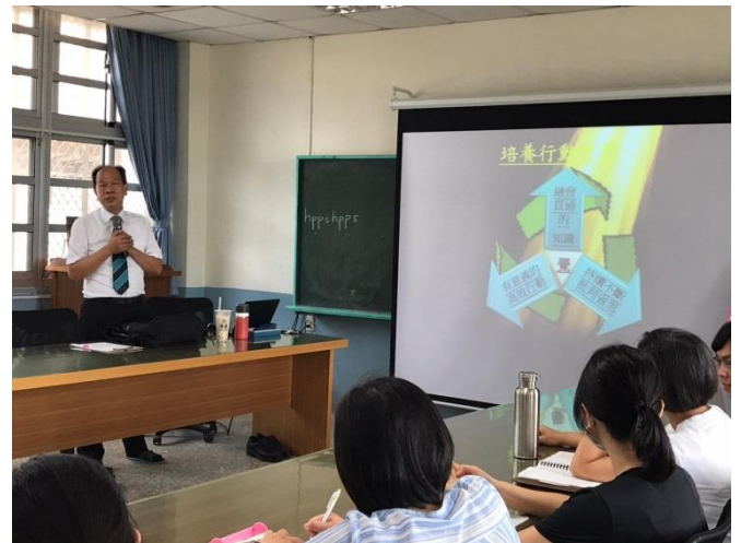
圖說：外聘教授指導教師精進策略研習