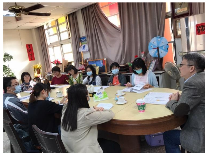
圖說：外聘教授指導教師觀課