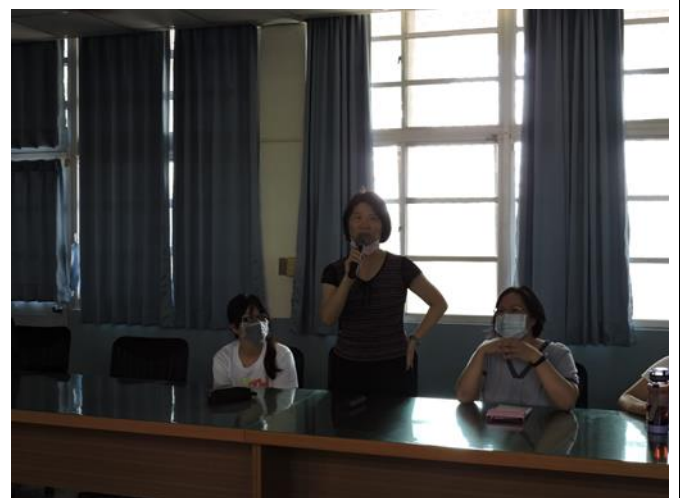
圖說：科任老師回饋分享