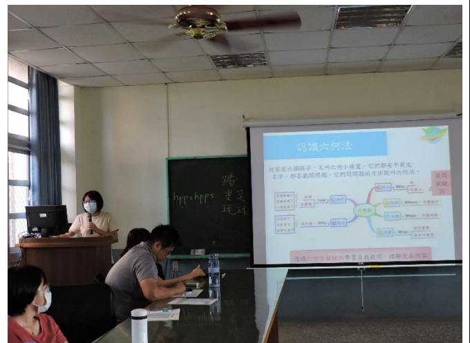
圖說：國語文閱讀理解策略分享