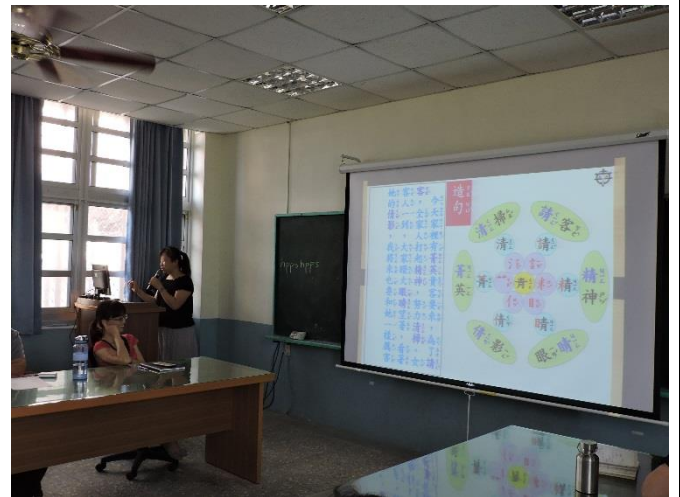
圖說：國語文閱讀理解策略分享