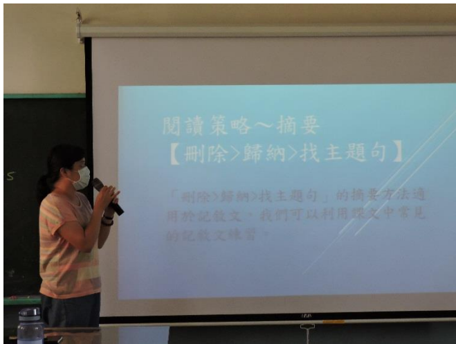
圖說：國語文閱讀理解策略分享