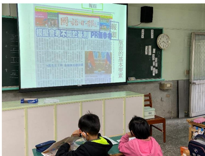
圖說：利用簡報，認識報紙