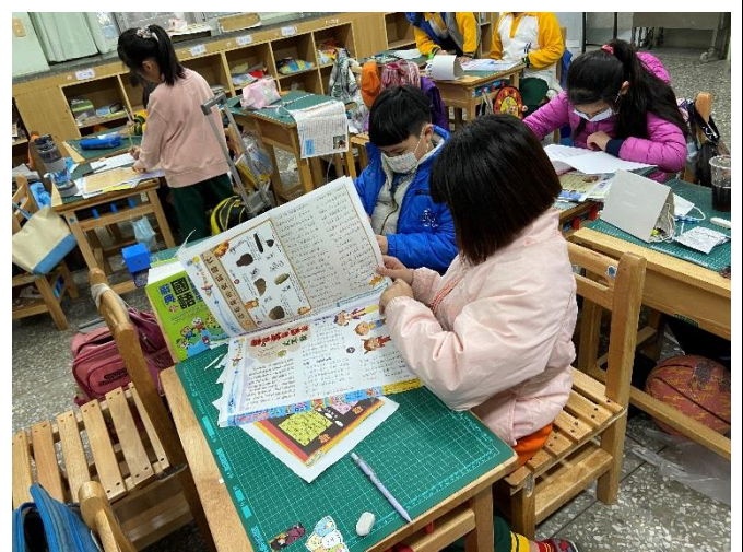
圖說：閱讀週刊並完成學習單