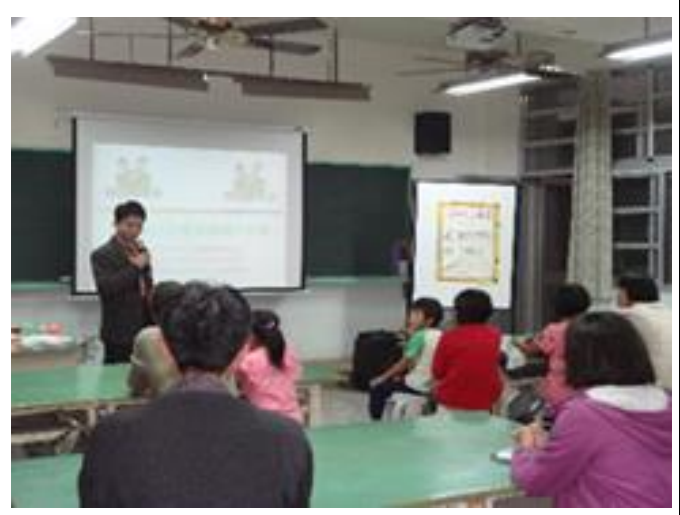
圖說：家庭教育講座外聘講師親子共讀策略研習