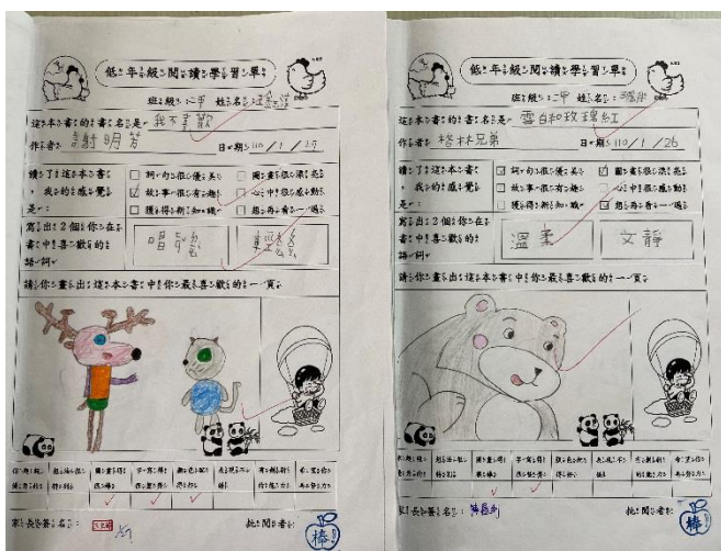
圖說：親子共讀，完成學習單