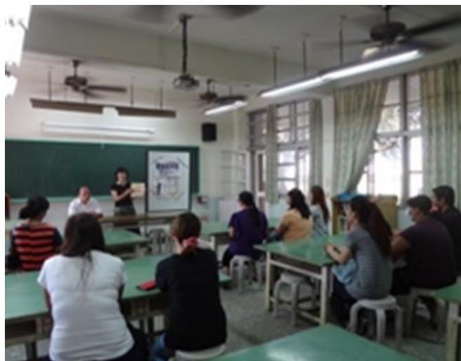
圖說：校長於家庭教育講座分享親子共讀策略