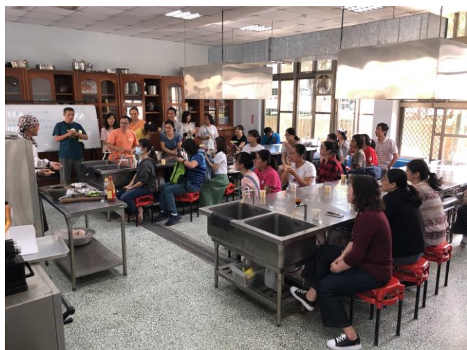
說明：講師向學員說明手作注意事項