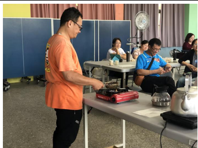
說明：讓學員直接體驗烘焙咖啡豆