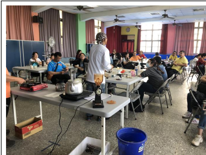
說明：講師向學員簡介有機咖啡