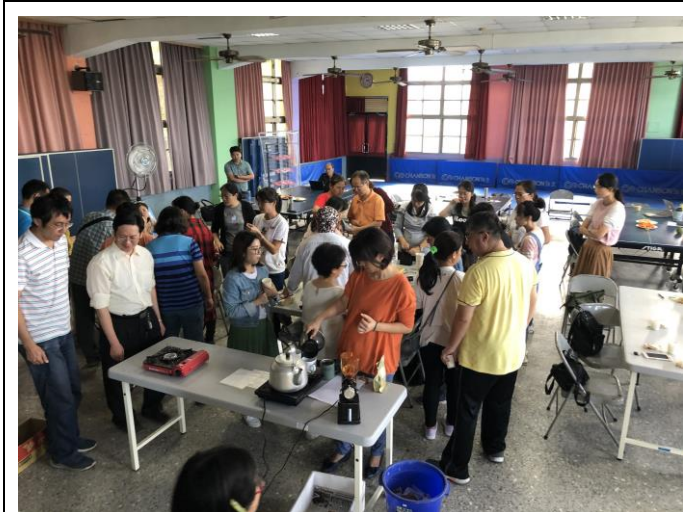
說明：講師向學員們分享成果