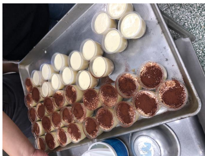
說明：學員們完成的作品