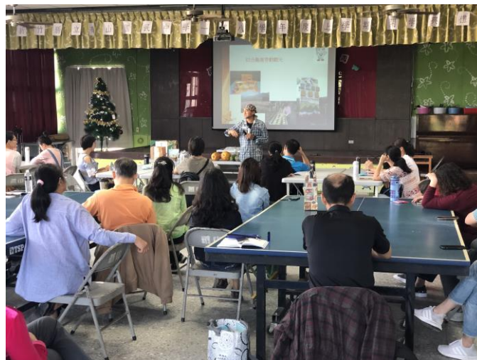
說明：講師向學員分享農務經驗