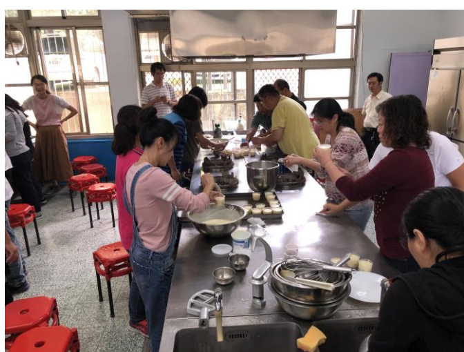
說明：學員們分工合作完成作品