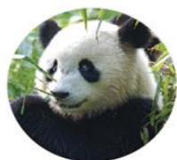
貓熊 Ailuropoda Melanoleuca

↑ 族群變化-增加 Increasing ↓ 族群變化-減少 Decreasing ? 族群變化-不明 Unknown ⊖ 族群變化-穩定 Stable