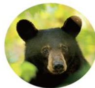
美洲黑熊 Ursus Americanus