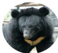
亞洲黑熊 Ursus Thibetanus