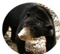
馬來熊 Helarctos Malayanus