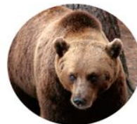
棕熊 Ursus Arctos