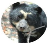
眼鏡熊 Tremarctos Ornatus