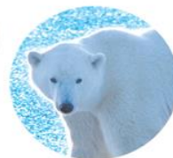
北極熊 Ursus Maritimus