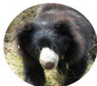
懶熊 Melursus Ursinus