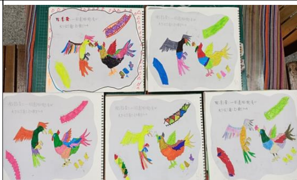
除草祭田邊好朋友