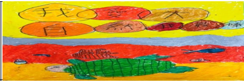
<我愛大自然 我最棒> Husung Takistalan 海龜和垃圾一起游泳，我們應該要減少塑膠垃圾、愛護大自然。