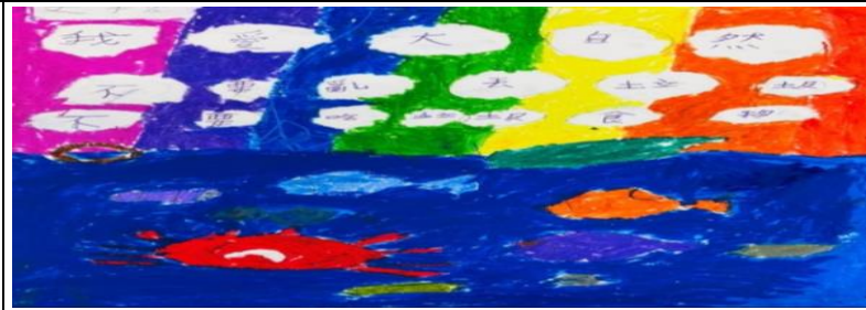
<我愛大自然 不亂丟垃圾吃垃圾食> Sani Takiscibanan 大螃蟹和小魚兒很不開心，因為牠們和垃圾生活在一起，我們要減少塑膠的使用，愛護大自然。