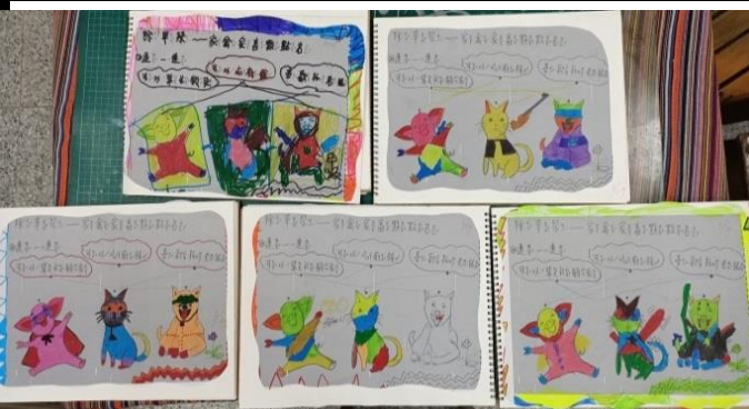
除草祭家禽家畜點名