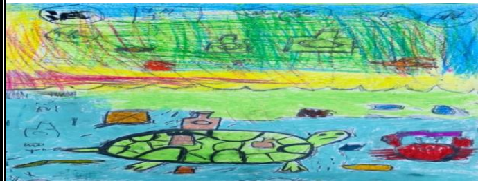
<減塑減塑 我最棒> apu'u luhiacana 海水裡有非常多的垃圾，大海龜的殼上也背了許多垃圾，牠很不舒服也很不快樂。