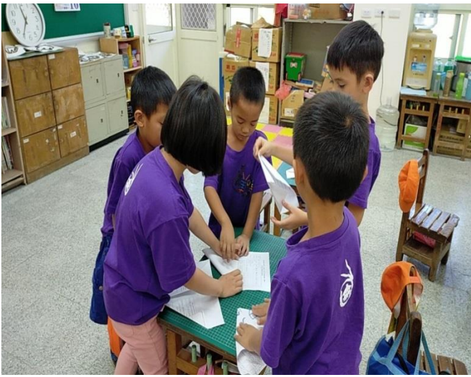
龍捲風(紙蛇)製作， 看誰剪得長。