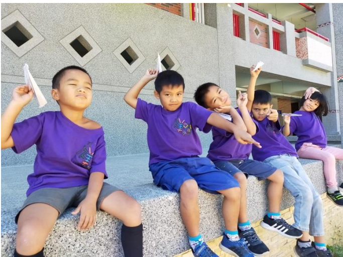
紙飛機試飛， 看誰飛得遠。