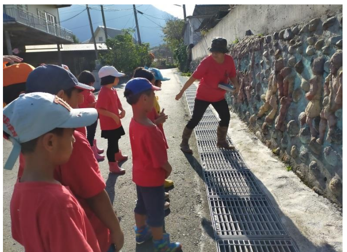
部落巡視—— 認識久美部落壁畫圖騰。