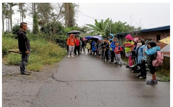
與乜寇作家有約， 作家教導學生認識植物。