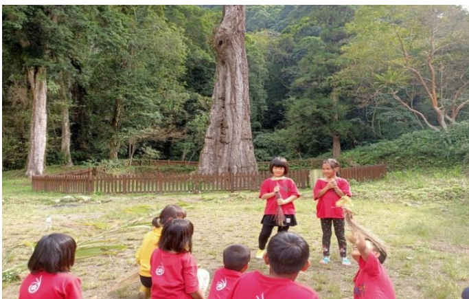
山林教育， 在神木前發表作品的心得。