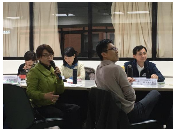
研習中進行「我訊息」實例情境分享