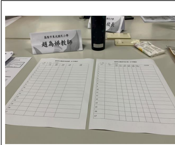
參與教學行動研究培訓研習