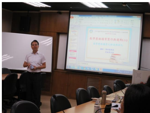
葉昆靈教授主講教學歷程檔案製作與運用課程