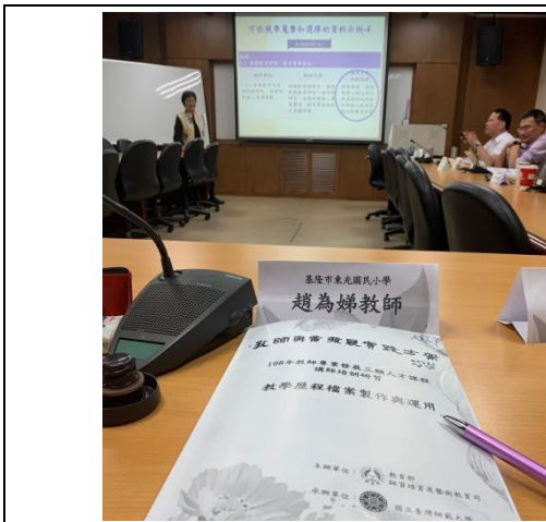
參與教學歷程檔案製作與運用培訓研習