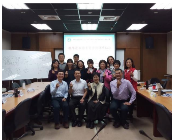
全體學員與講師合影留念