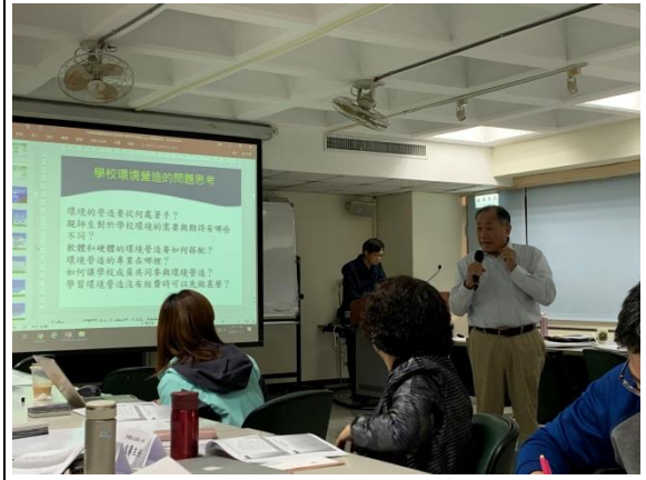
吳明清教授主講教學行動研究課程