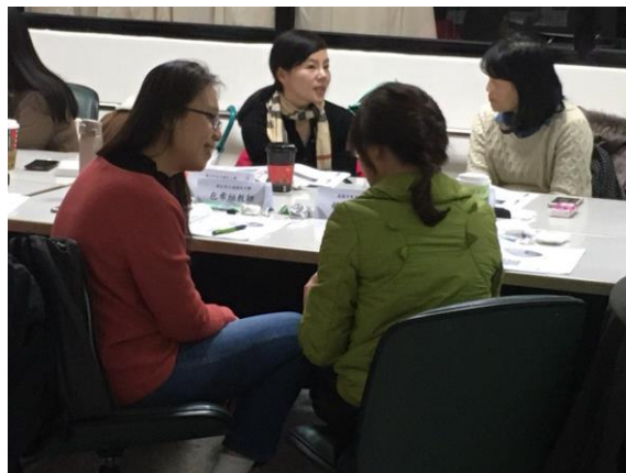
學員兩兩一組進行「傾聽」的演練