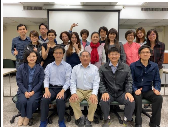
全體學員與講師合影留念