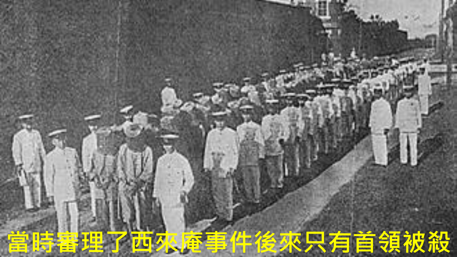
當時審理了西來庵事件後來只有首領被殺