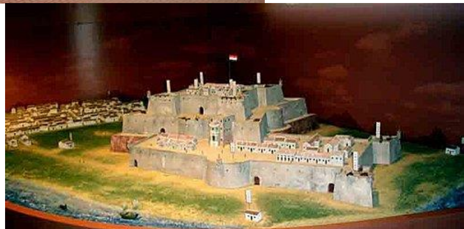
熱蘭遮城分內外二部，城垣範圍包括台灣最古老的延平市街。