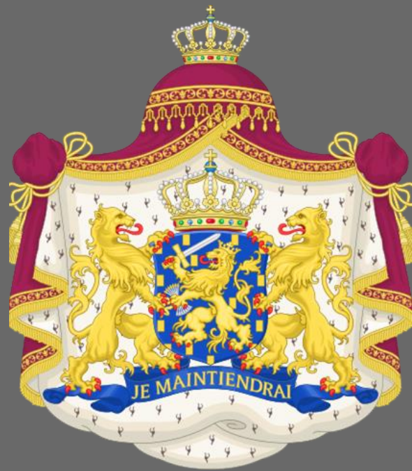
奧倫治-拿索王室徽章（荷蘭國徽）