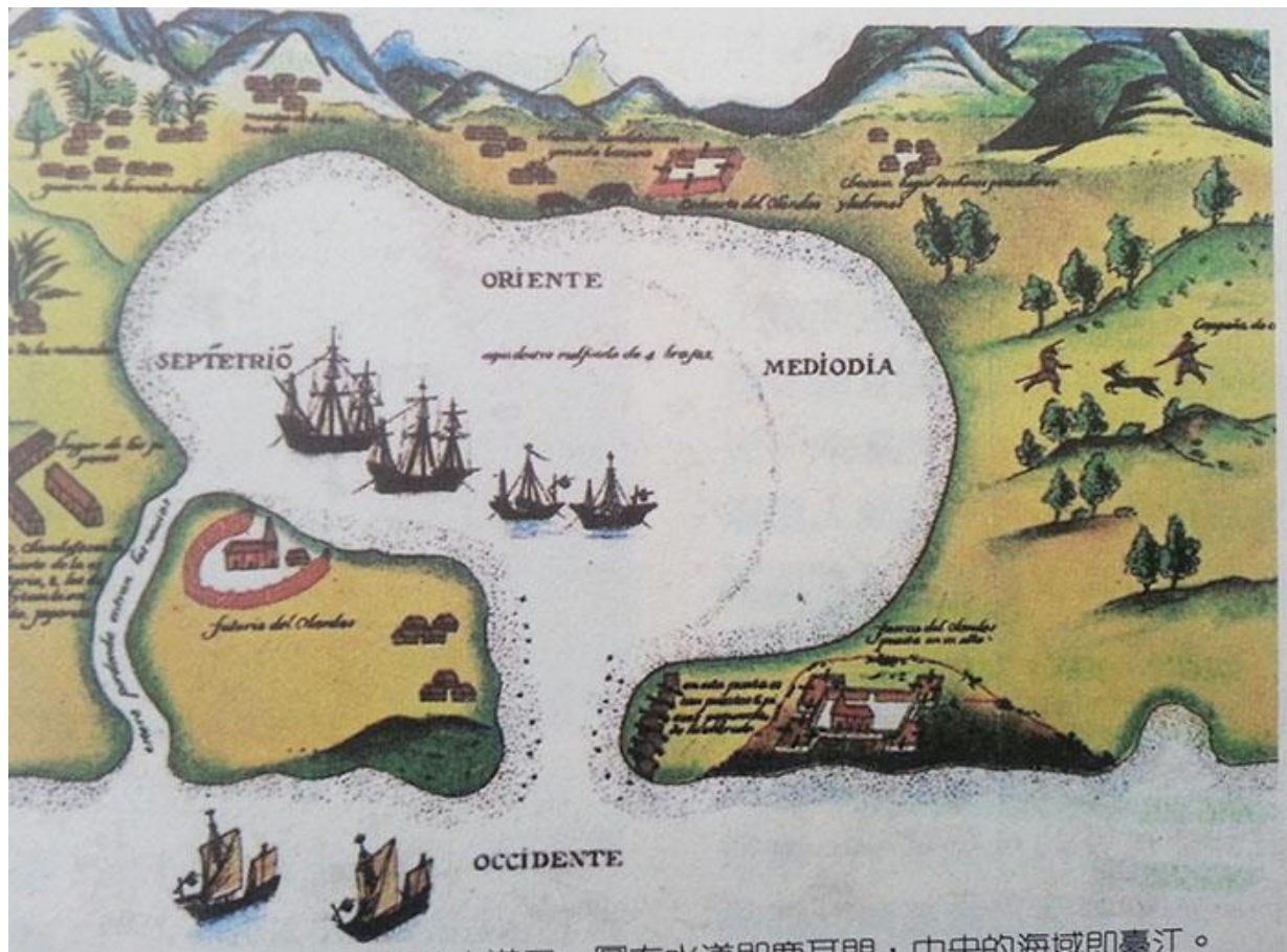
圖：葡萄牙人所繪荷蘭人在大員(台江內海)活動圖。