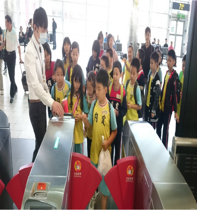
高 鐵 之 旅 -學 習 工 使 用 車 票 公