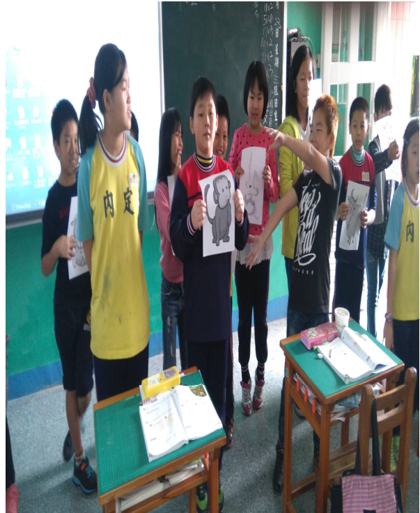
母 語 日 語 文 發 表 練 習 習