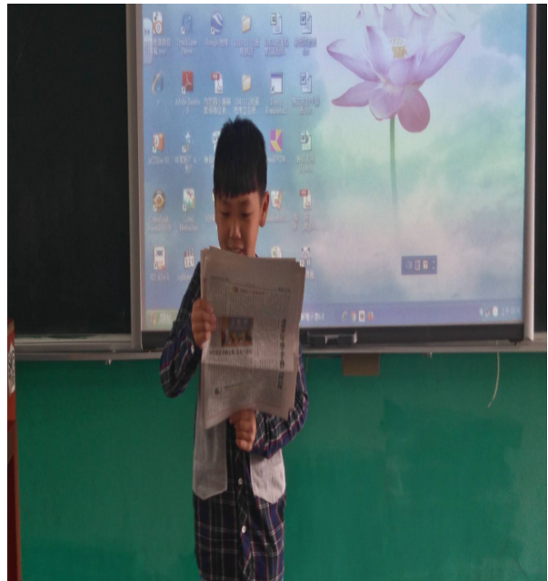
班 級 讀 報 分 享