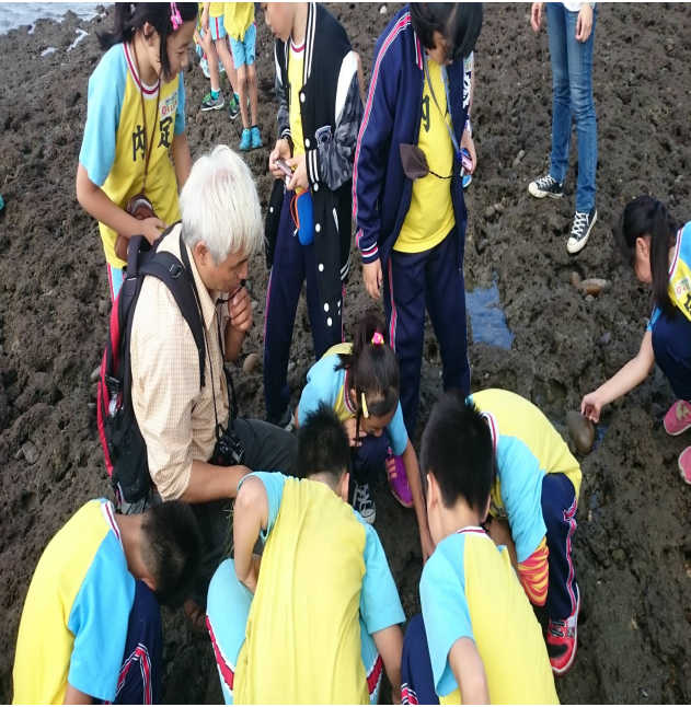
校 外 教 學 -藻 礁 之 旅