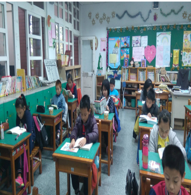
晨 讀 -靜 公 悄 公 悄 公