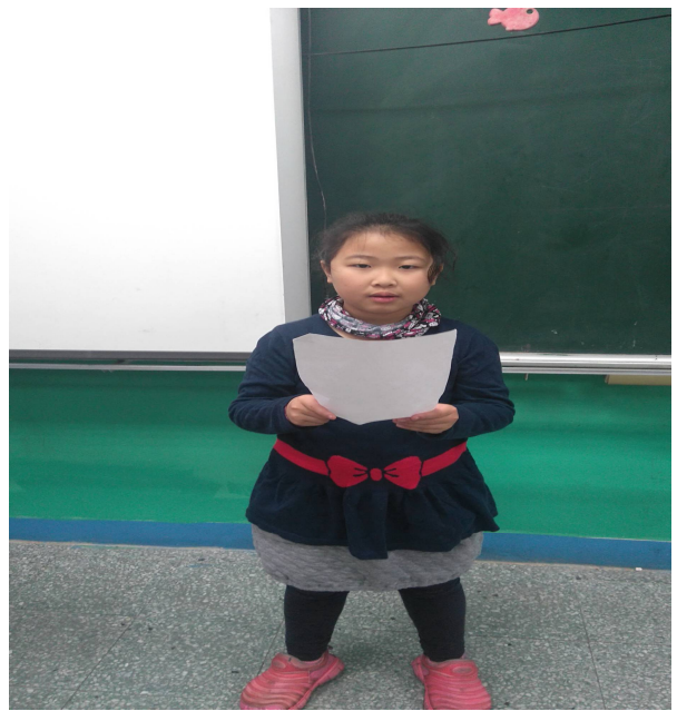
語 文 競 賽 班 級 代 表 上 台 練 習