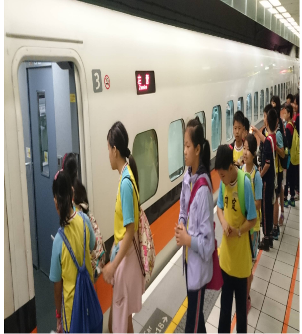
排 隊 體 驗 高 速 鐵 路