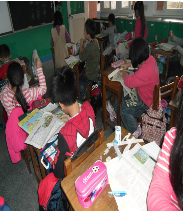
全 心 全 意 -做 剪 報 報