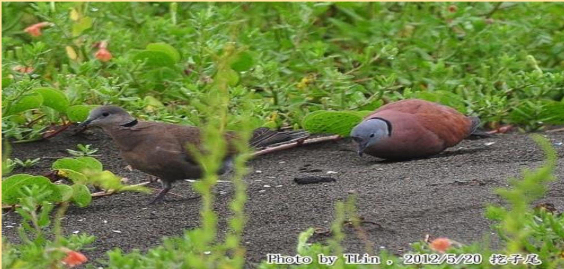
2012/5/20 挖子尾