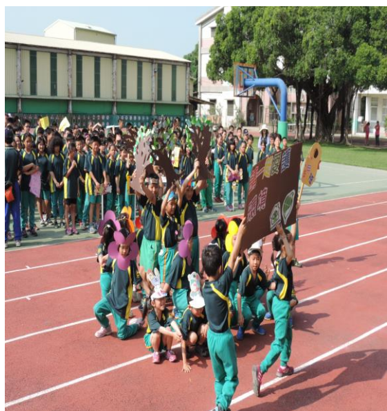
保護好環境，資源永續發展，生生不 息