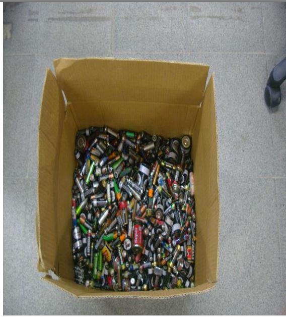
廢電池回收一大箱