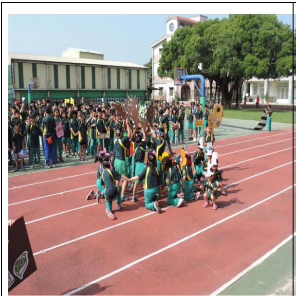
運動員進場進行境教育議題宣導： 愛護樹木及小動物表演