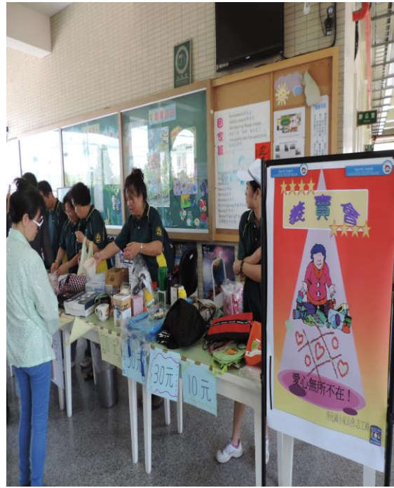
資源再利用-二手物品交流