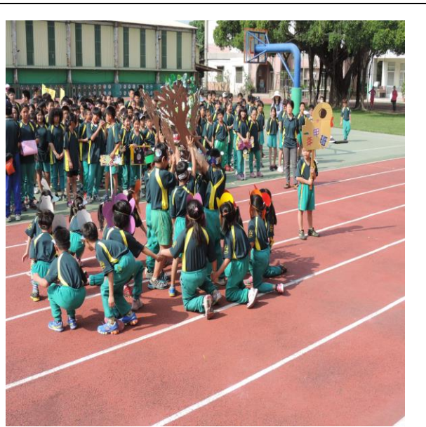
進行愛護環境標語宣達