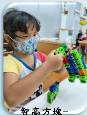
智高方塊-勺叉勺叉車