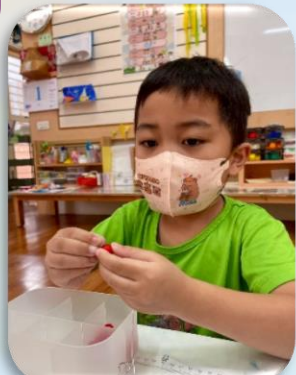
串珠-練習顏色排序