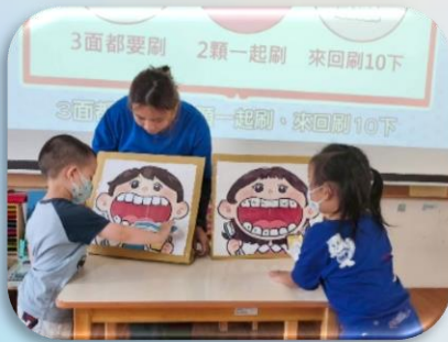
邀請幼兒示範刷牙