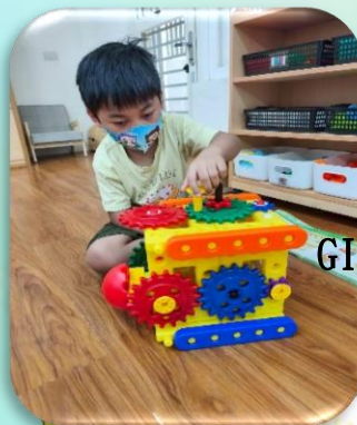
GIGO工程組 電影播映機