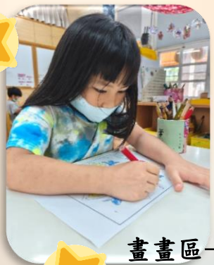
畫畫區-自由仿畫動物