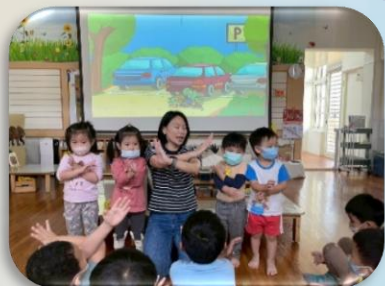
交通安全的重要性

為了讓孩子每天都能平安上學、快樂回家，本週一起學習交通安全的重要觀念。小朋友要坐在適合年齡與身高的安全兒童座椅上。走路與過馬路時，要記得「停、看、聽」，先停下腳步，看看左右有沒有來車，不奔跑、不嬉戲。也要提醒孩子不要在車子的前方或後方玩耍，因為車輛周圍有駕駛看不到的視線死角，容易發生危險。讓一起養成良好的交通安全習慣。