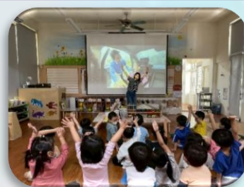
要系安全帶坐安全座椅

透過每日大肌肉活動，促進幼兒大腦整合，提升其運作更活絡，使神經、骨骼及肌肉獲得良好發展，可增加身體的協調性和危機反應能力外，也能透過遊戲中提升幼兒的穩定情緒與專注力。