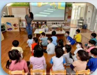
過馬路要左看右看