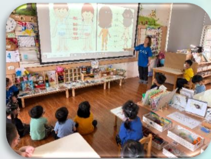
認識身體重要部位

透過每日大肌肉活動，促進幼兒大腦整合，提升其運作更活絡，使神經、骨骼及肌肉獲得良好發展，可增加身體的協調性和危機反應能力外，也能透過遊戲中提升幼兒的穩定情緒與專注力。