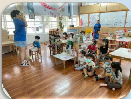
分享保護眼睛的方法

日常護眼計畫推動，依幼兒發展設計適齡活動，透過繪本、影片及遊戲引導、視力保健遊戲和戶外活動，培養正確用眼習慣，如保持適當距離、充足光線和定時休息。並結合生活作息，減少3C使用時間，讓幼兒在自然情境中學習愛護眼睛，守護視力健康。