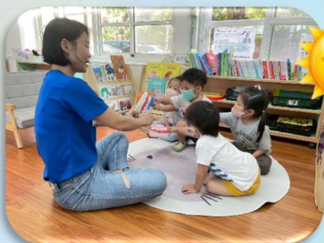
繪本分享我會刷牙