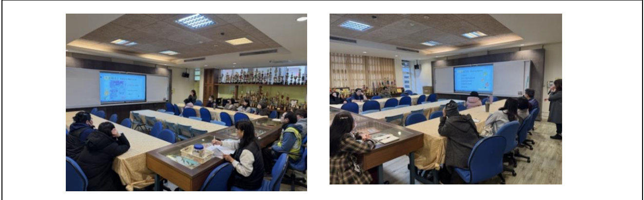
午秘進行午餐相關專題及業務報告。