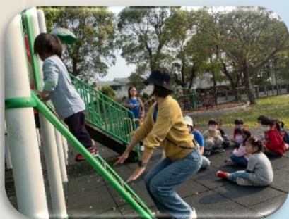
正確使用遊樂器材

老師透過戶外遊戲場實際引導幼兒學習正確使用遊樂器材，並藉由繪本讓幼兒了解教室中也存在潛在危險，學習保護自己。此外，老師示範剪刀的正確拿取方式，並讓幼兒實際練習，提升其安全意識。