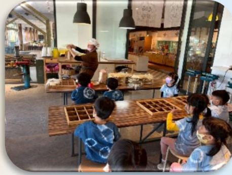
介紹米粉製作方式