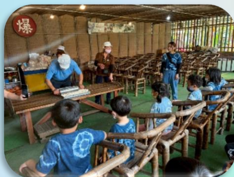
認識爆米香的製作過程