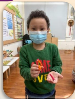
黏土區-老虎鑰匙圈