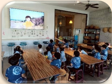
觀看米粉的由來影片

幼兒們在客語情境中參與製作，不僅提升聽說能力，也培養文化認同，讓學習更生活化且富有樂趣。