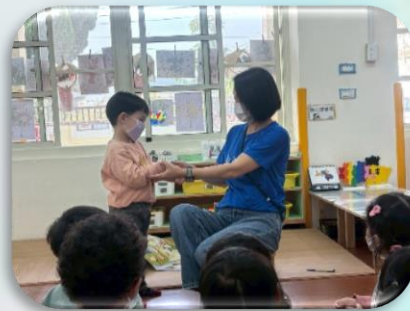
幼兒示範如何正確拿取剪刀

透過每日大肌肉活動，促進幼兒大腦整合，提升其運作更活絡，使神經、骨骼及肌肉獲得良好發展，可增加身體的協調性和危機反應能力外，也能透過遊戲中提升幼兒的穩定情緒與專注力。