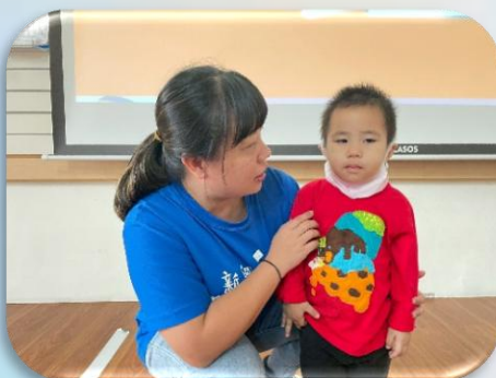
我會自己整理書包