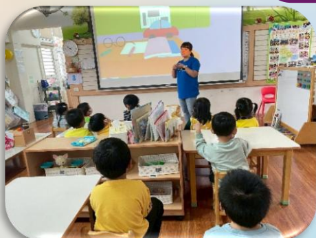
分享生活教育觀念

透過日常活動融入生活教育，引導幼兒學習如洗手、穿脫衣物、整理物品及使用禮貌語等基本自理能力及生活禮儀。在實際操作與反覆練習中，逐漸建立責任感及良好生活習慣，並從互動中學習尊重與關懷，為未來社會行為打下良好基礎。