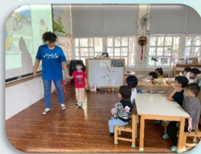
示範如何安全過馬路

透過每日大肌肉活動，促進幼兒大腦整合，提升其運作更活絡，使神經、骨骼及肌肉獲得良好發展，可增加身體的協調性和危機反應能力外，也能透過遊戲中提升幼兒的穩定情緒與專注力。