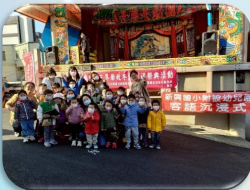
參與客家傳統文化-收冬戲