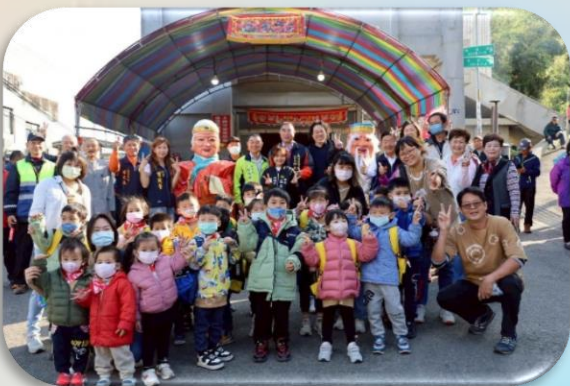
參與客家傳統文化活動