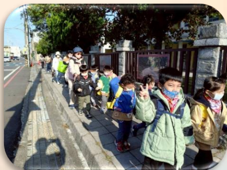
步行上興里活動中心

透過這次文化體驗，幼兒不但更貼近在地客家生活，也對傳統藝陣有了初步而深刻的認識。