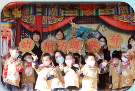
新興國小附幼表演大成功