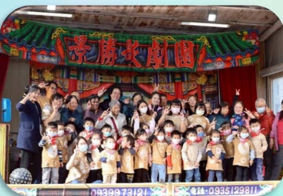
與藝耆協會及嘉賓合影