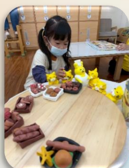
說演故事-野貓軍團烤麵包