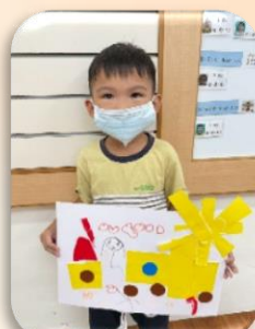
紙藝區-形狀貼畫(車子)