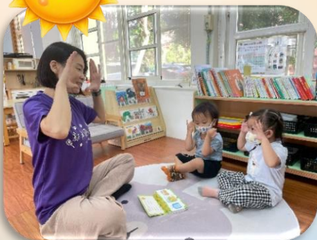
認識生活周遭物品