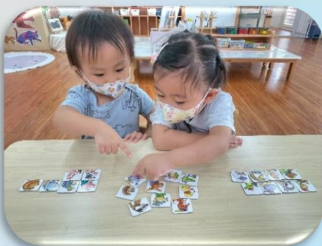
找一找，小動物在哪裡