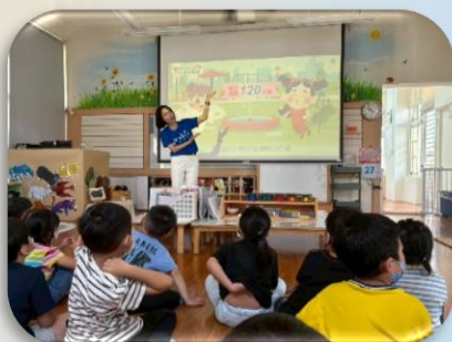
分享靈魂之窗重要性

為保護幼兒視力健康，宣導推動護眼計畫，透過安排每日戶外活動時間、減少近距離用眼行為，並營造明亮舒適閱讀環境，引導建立良好用眼習慣。同時也融入E字視力圖辨識遊戲，讓幼兒在趣味操作中初步學習視力檢查方式，提升視覺覺察力，從小認識護眼之重要性。