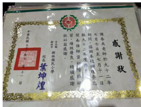
鄉土語言閩南語師資班研習證照