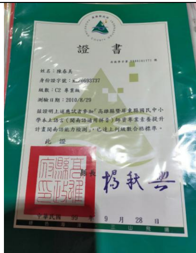
閩南語能力檢測 C2 專業級