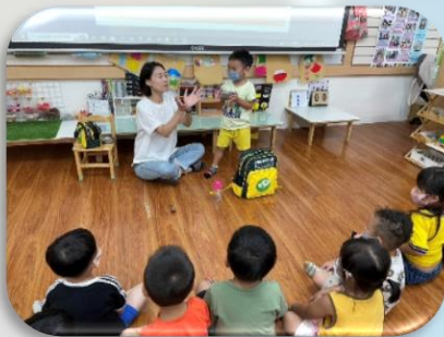
上學物品客語名稱

從生活中聽及簡單詞彙一點一滴學習客語，並搭配動作、物品及歌謠進行連結，幼兒都能嘗試說說看，回家也都當小老師與家人說客語，透過遊戲及生活對話學習不同文化及語言喔！