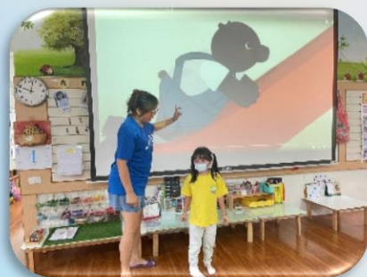
正確使用遊具方法