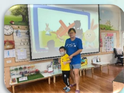
教室內勿推擠奔跑

透過每日大肢體活動，促進幼兒大腦整合，提升其運作更活絡，使神經、骨骼及肌肉獲得良好發展，可增加身體的協調性和危機反應能力外，也能透過遊戲中提升幼兒的穩定情緒與專注力。