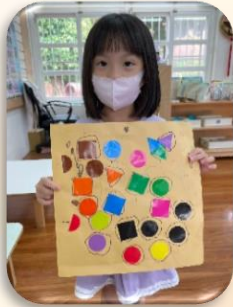
形狀拼貼-花花世界