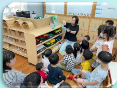
介紹Gigo工程組積木特性