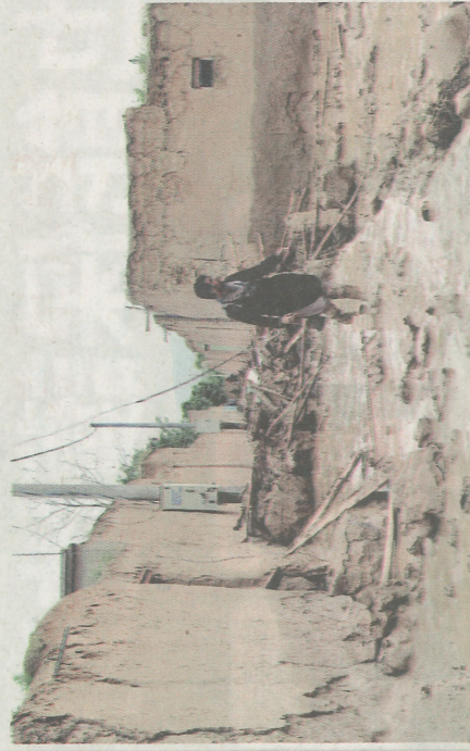
▲塔利班日前閱兵，慶祝掌權三年（右圖）。然而，阿富汗民眾仍深陷貧困，今年春季的洪水，更沖垮許多人的家園（左圖）。