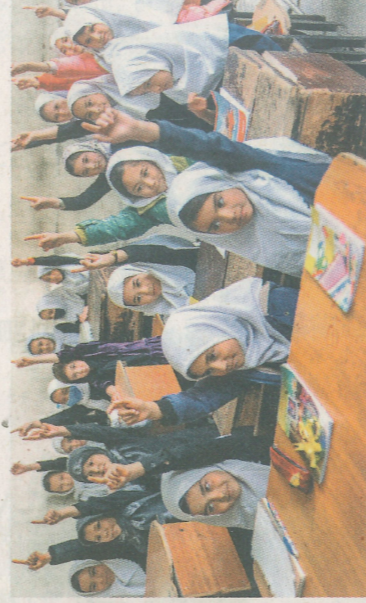
▲阿富汗女童被塔利班禁止上中學。

【作文小學堂】請挑選一則國際新聞議題作主題探究，書寫你對該議題的了解與想法，參加本月引導式徵文，文長五百字。