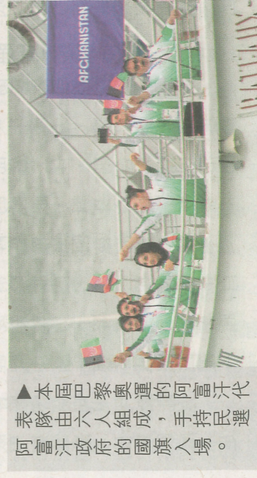
▲本屆巴黎奧運的阿富汗代表隊由六人組成，手持民選阿富汗政府的國旗入場。

塔利班是一個極端壓迫女性的政權，奪權以來陸續禁止女性接受小學六年級以上的教育，禁止女性在非政府