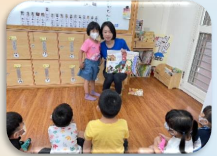
我最喜歡上學了繪本分享