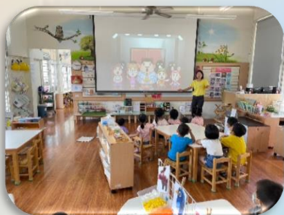
地震來了影片分享

為提升幼兒對於防震防災的概念，老師帶領幼兒一同實地演練，並說明當地震來時須先尋找堅固的桌子下實行防災三步驟「趴下、掩護、穩住」，待地震停止後為了怕有餘震，需跟隨老師至戶外空曠處避難，培養保護自己與他人的防災意識。