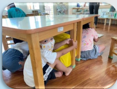
趴下 掩護 穩住