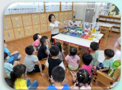
學習區操作方式介紹