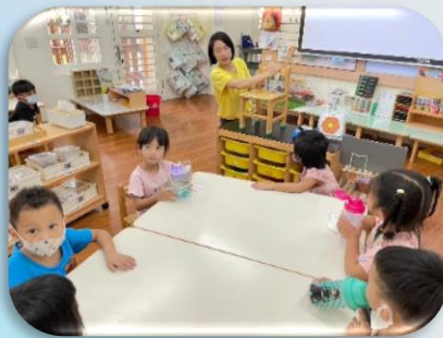
我會打掃整理環境