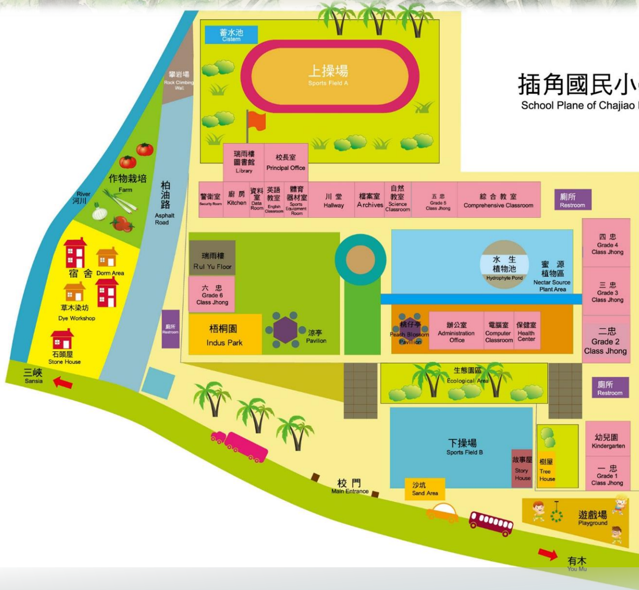
插角國民小學平面圖 School Plane of Chajiao Elementary School