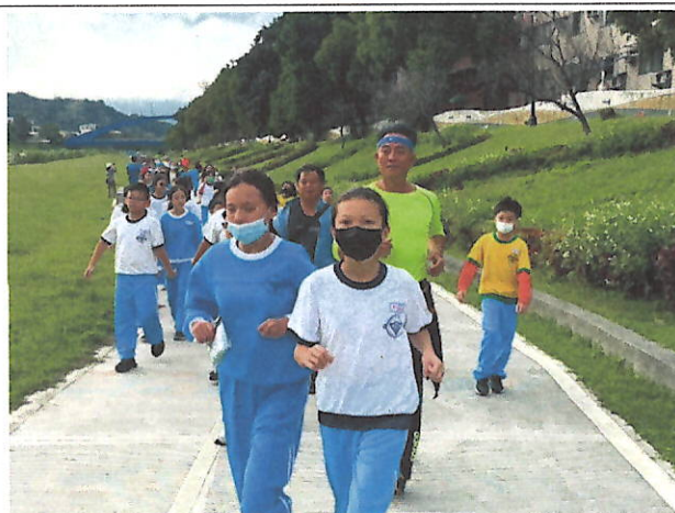
家長與孩子路跑照片