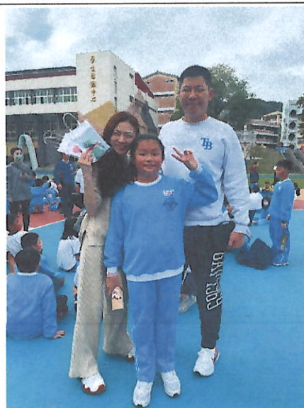
家長們陪同孩子完成路跑活動