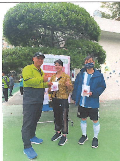
頒發完賽證明及小禮物