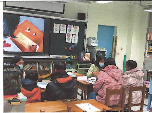
特教班家長日-親師懇談照片