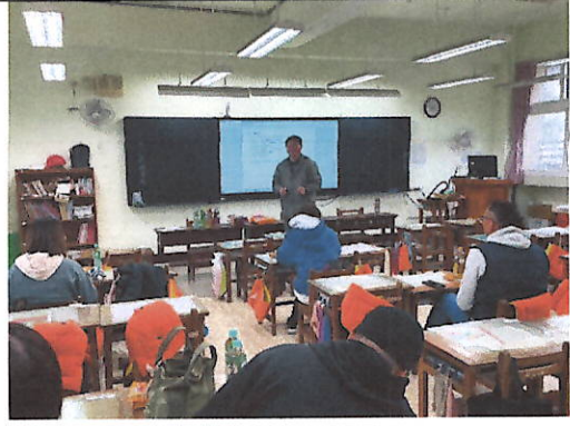
中年級家長日-親師懇談照片