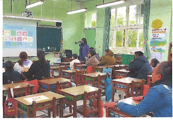
低年級家長日-親師懇談照片