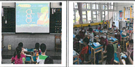
相招來開講---基數、量詞教學