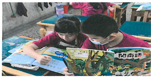
學生因仔看課本討論俗框字詞