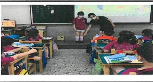
學生因仔上台分享穿插