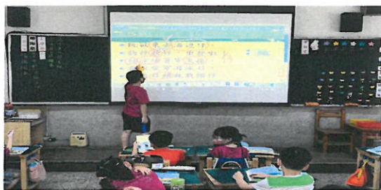
學生因仔上台讀課文