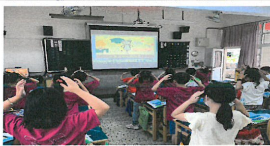
學生因仔唱歌佢跳舞