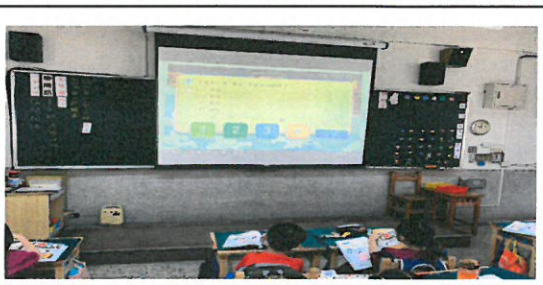
回答「彈跳高手」遊戲题目的答案