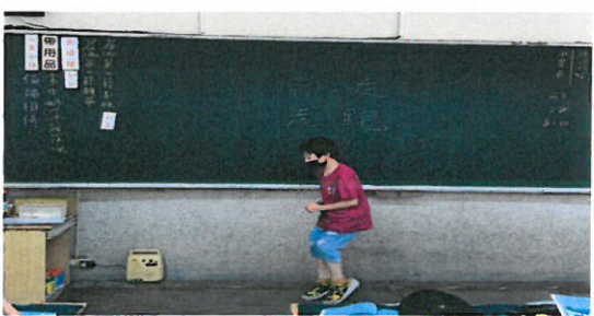
學生因仔表演閩南語「行=走 走=跑」