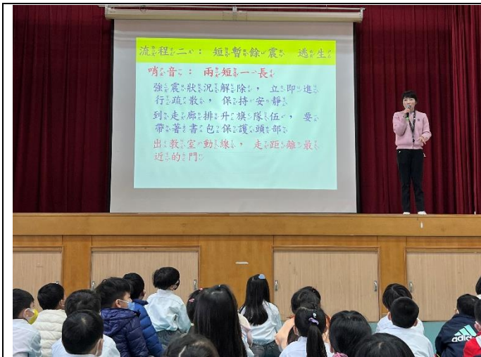
說明：說明地震逃生的警示哨音