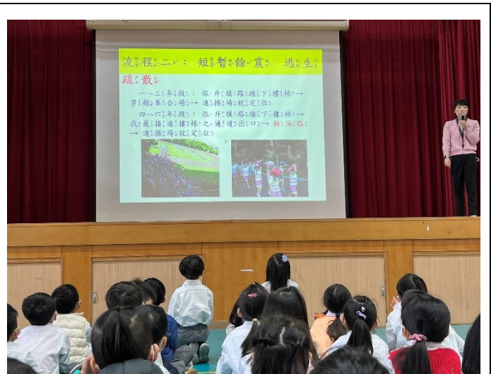
說明：地震逃生路線說明與集合地點