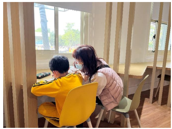
志工針對疑似學習障礙生進行學習輔導