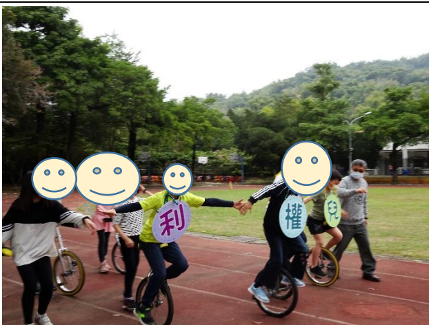
安排特教生、特殊境遇生進行獨輪車團體輔導活動，並於校慶等大型活動給予展演機會，建立自信舞臺。