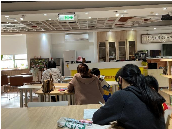
安排志工協助特教生的學習輔導