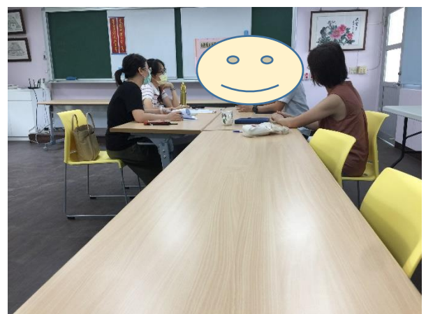
個別化的親師座談，有效提供家庭支持及協助。