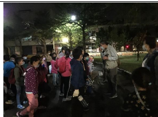
申辦愛迪生計畫，邀請中興大學楊正澤教授進行親子昆蟲科學普課程，探索昆蟲世界的奧秘，建立親子科學探究意識。