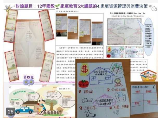
教師探究家庭發展、家庭與社會互動關係