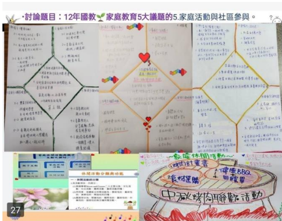
提升積極參與家庭活動的責任感與態度