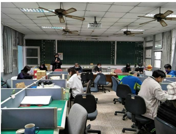
教師實際體驗操作「熱情卡+愛情卡+強項卡+生涯卡」